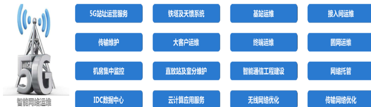
图表 长实通信业务介绍

2、通信网络维护业务主要是由长实通信对通信运营商及铁塔公司所拥有的网络资源实行运行管理、故障维修及日常维护等全方位的专业技术服务，保障网络正常运行，提高通信网络质量和运行效率。维护服务的内容包括基站、线路、宽带接入、固定电话接入、WLAN 的运行管理和维护保障。