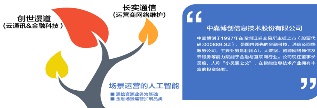
图表 上市公司企业概述及主要业务

公司主要业务为信息智能传输、通信网络维护。本公司为控股型企业，主要业务由二家全资子公司创世漫道和长实通信经营，创世漫道主营信息智能传输；长实通信主营通信网络维护。