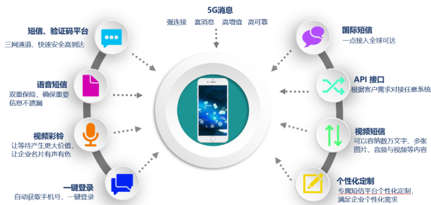
图表 信息智能传输业务的产品体系

1、信息智能传输业务即创世漫道利用通信运营商移动通信网络系统及互联网，凭借自主研发的独立系统核心处理平台，向行业分布广泛、数量众多的企业公司、事业单位等客户提供的指定手机用户发送有真实需求的身份验证、提醒通知、信息确认、信息告知等触发类和具有真实需求的短信(含彩信、下同)，包括文字、图片或语音等格式载体，以及将指定手机用户向客户发送的短信息收集并回传的服务。同时为客户提供短信发送的各类接口产品及技术支持。