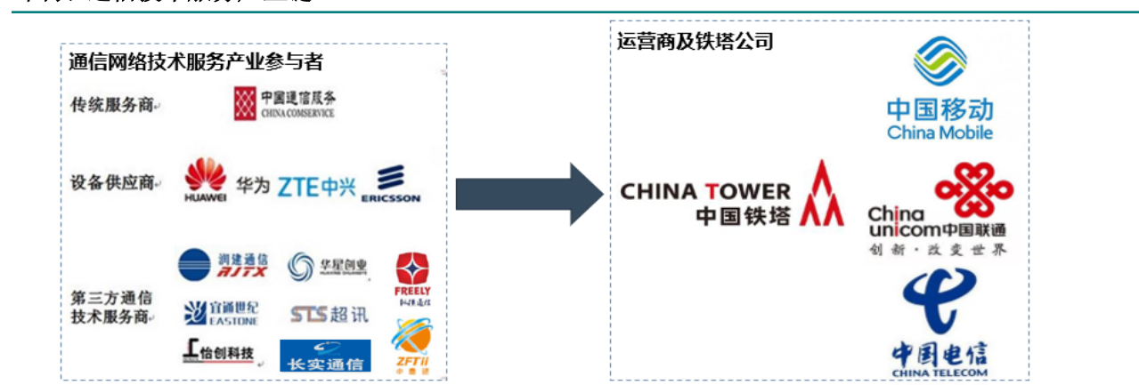
图表 通信技术服务产业链

通信网络技术服务产业：跟随运营商的资本投入，螺旋式上升。通信服务市场由传统服务商、设备厂商和第三方通信服务商组成。通信网络的建设与维护最早由运营商自行承担，不存在市场竞争。随着通信网络技术的不断升级、网络规模增大以及通信运营商对服务重视程度的提高，从事通信网络建设与维护的专业服务商不断涌现。