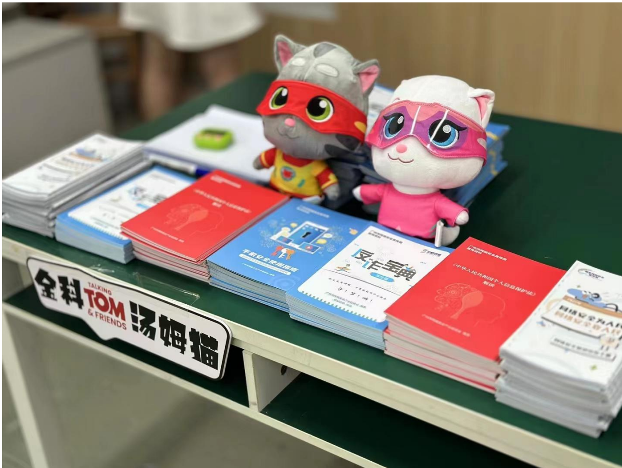
(图 6: 广州金科少年儿童健康成长活动宣传图)

家族 IP 形象的正向引导力与互动游戏相融合, 以益智有趣的体验形式普及网络安全知识, 为青少年的“快乐暑假”保驾护航。与此同时, 在生成式人工智能技术快速发展的背景下, 报告期内, 公司对外投资了儿童阅读工具应用 KOBi, 该应用根据不同的儿童用户的兴趣生成自定义的故事和阅读材料, 有助于帮助具有阅读困难症的儿童完成阅读并激发儿童用户的阅读兴趣。