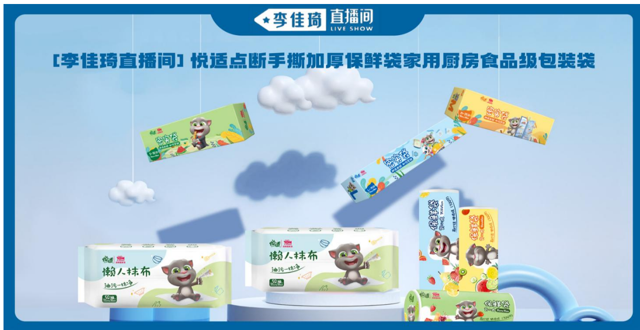
(图 3: 李佳琦直播间汤姆猫家族 IP 衍生品展示图)