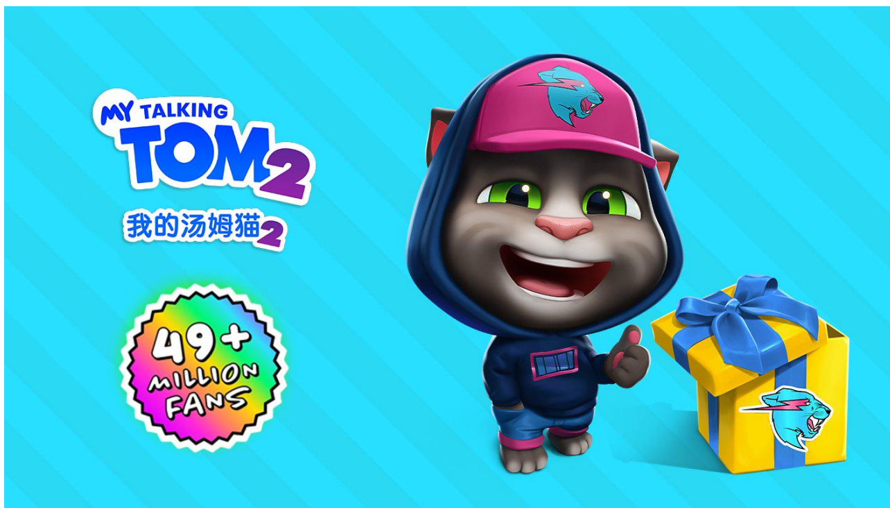
(图 1: 游戏产品《我的汤姆猫 2》海报图)

告期内, 公司旗下《种地勇者》《汤姆猫小小勇士》《沼泽激战 2》《山海进化录》等产品已先后取得版号。其中, 由公司国内团队研发的 RPG 游戏《种地勇者》已于今年 4 月正式上线国内市场, 该产品融合了收集、探险、建造等多种玩法元素, 一经上线即登上 APP Store 游戏免费榜(模拟品类)首位, 并连续多日位居 TapTap 游戏热门榜前列。在已上线产品的长线运营上, 为庆祝公司旗下经典虚拟宠物养成产品《我的汤姆猫》上线十周年, 公司对《我的汤姆猫 2》开展了重大玩法与经济系统更新, 游戏内容的创新性延展将有利于提升《我的汤姆猫》《我的汤姆猫 2》等经典虚拟宠物游戏的用户活跃与黏性, 促进产品的长线表现; 此外, 为进一步优化游戏内部机制, 公司上半年开展了在养成类游戏中推广新的经济体系的有效尝试, 初步测试数据显示, 新的经济体系带来用户留存率、用户时长、平均日活用户收入等指标的增长, 后续公司将根据测试数据的持续表现, 将新的经济系统逐步推广至其他产品中。基于汤姆猫家族 IP 系列产品过硬的产品品质与精细化运营, 报告期内, 《我的汤姆猫》《我的安吉拉》《汤姆猫跑酷》《我的汤姆猫 2》《汤姆猫英雄跑酷》《汤姆猫总动员》以及《我的安吉拉 2》等核心矩阵产品均保持了千万级人次的月均活跃用户数。