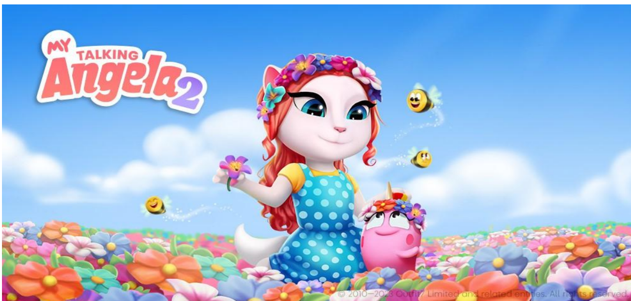
(图 8: Outfit7 公司绿色游戏创意计划活动宣传图)

公司始终倡导并践行绿色环保、低碳节能的经营方式。报告期内，公司主动响应联合国环境规划署下设联盟“绿色游戏创意计划活动”，结合公司互联网移动应用业务特点，在《我的安吉拉 2》《汤姆猫跑酷》游戏内设置环保主题互动内容，以有趣的玩法设计和游戏交互媒介形式广泛传播生态保护知识和理念。在开展丰富的线上活动同时，公司海外子公司 Outfit7 与公益组织共同捐赠资金用于亚马逊雨林濒危物种的保护，以实际行动助力全球生态改善。