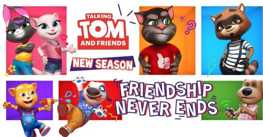
(图 2: 线上动漫影视作品展示图)

在线上动漫影视内容上, 公司基于汤姆猫家族 IP 推出的系列动画片、短片及迷你剧等动漫影视作品, 在 YouTube、Netflix 等渠道保持了高人气热播, 公司动画系列在 YouTube 上的订阅用户数突破 1 亿人次, 全球累计播放量超过 1,000 亿次。后续公司将持续推进寓教于乐的高品质动漫内容制作, 不断强化 IP 影响力, 满足少年儿童的多元文化需求。