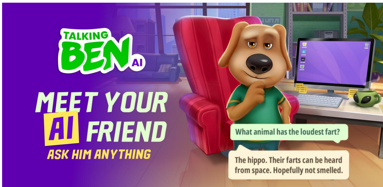
(图 5: 汤姆猫国外 AI 测试产品展示图)

为进一步满足公司通用人工智能（AGI）及 AI 终端交互产品等业务发展的需求，实现从“会说话的汤姆猫”向“会聊天的汤姆猫”的迭代升级，增强公司长期综合竞争力，公司于 2023 年 7 月 15 日披露了《2023 年度向特定对象发行 A 股股票预案》等相关公告，公司拟向特定对象发行股票募集资金总额不超过 230,011.42 万元，募集资金计划投向汤姆猫家族 IP 系列 AI 交互终端产品项目、垂直领域模型开发项目、高密度大数据算力基础设施项目及补充流动资金。上述股票发行预案已经公司股东大会审议通过，尚需深圳证券交易所审核通过并经中国证券监督管理委员会同意注册后方可实施。