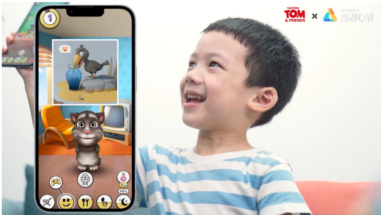
(图 4: 汤姆猫国内 AI 测试产品展示图)

双方正积极推进兼具智商和情商的汤姆猫 AI 交互产品的研发落地工作。报告期内, 公司国内团队开发的人工智能产品已初步实现 AI 识物、AI 读图、AI 绘图、情境对话、英语口语启蒙等产品功能, 后续公司将持续完善视觉能力、高情商对话及情感感知等功能模块。