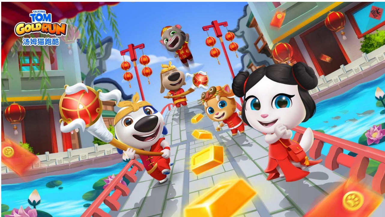
(图 7: 春节期间游戏产品内传播中国传统文化宣传图)

公司始终倡导并践行绿色环保、低碳节能的经营方式。报告期内，公司主动响应联合国环境规划署下设联盟“绿色游戏创意计划活动”，结合公司互联网移动应用业务特点，在《我的安吉拉 2》《汤姆猫跑酷》游戏内设置环保主题互动内容，以有趣的玩法设计和游戏交互媒介形式广泛传播生态保护知识和理念。在开展丰富的线上活动同时，公司海外子公司 Outfit7 与公益组织共同捐赠资金用于亚马逊雨林濒危物种的保护，以实际行动助力全球生态改善。