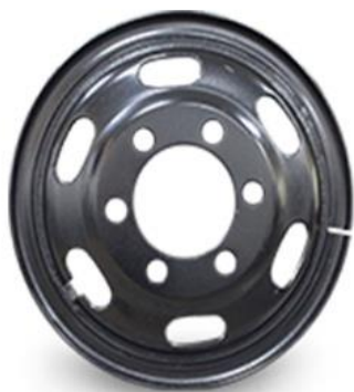
图 1：型钢钢轮（适用于特殊路况重载车型）

报告期内，公司汽车车轮业务的主要产品为型钢钢轮、轻量化无内胎钢轮和锻造铝合金轮毂，这些产品广泛应用于国内外客车、货车、牵引车、微卡等商用车领域。公司目前拥有厦门、四川南充、越南、漳州华安、唐山曹妃甸 5 个地区 7 个车轮生产基地，产品链齐全，可满足国内外整车厂和售后市场客户各种需求，“日上”车轮已经成为国内领先的知名钢轮品牌。