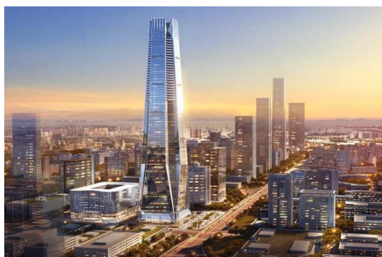
图7：NCC钢结构应用于超高层建筑