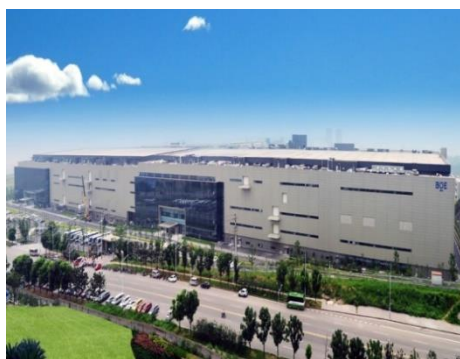
图6：NCC钢结构应用于高端电子厂房