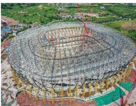
图8：NCC钢结构应用于体育场馆