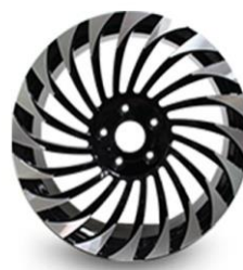
图 4：轿车锻造铝轮（新开发产品，应用于乘用车改装车）