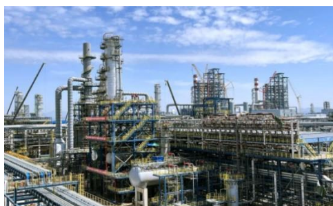
图9：NCC钢结构应用于石油化工领域