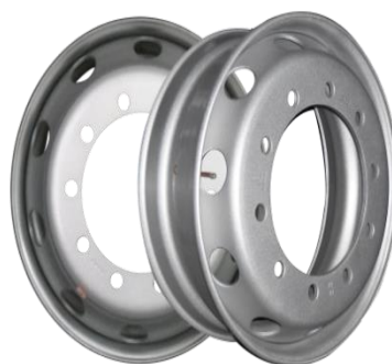
图 2：轻量化无内胎钢轮（适用于轻量化商用车型）