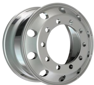
图3：锻造铝合金轮毂（适用于高端商用车型、新能源车型、特种车辆）