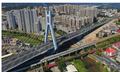
图10：NCC钢结构应用于公路跨线桥