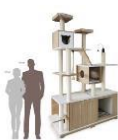
一体式家居猫别墅