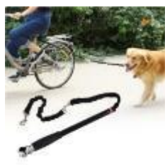
自行车遛狗牵引链