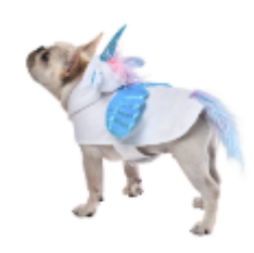
独角兽主题角色服