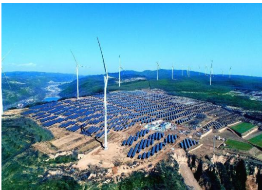
淳化中略 80MW 风电项目