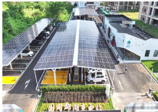
湖南省规模最大“光、储、充一体化”新能源汽车充电站——国网鄱湖充电站