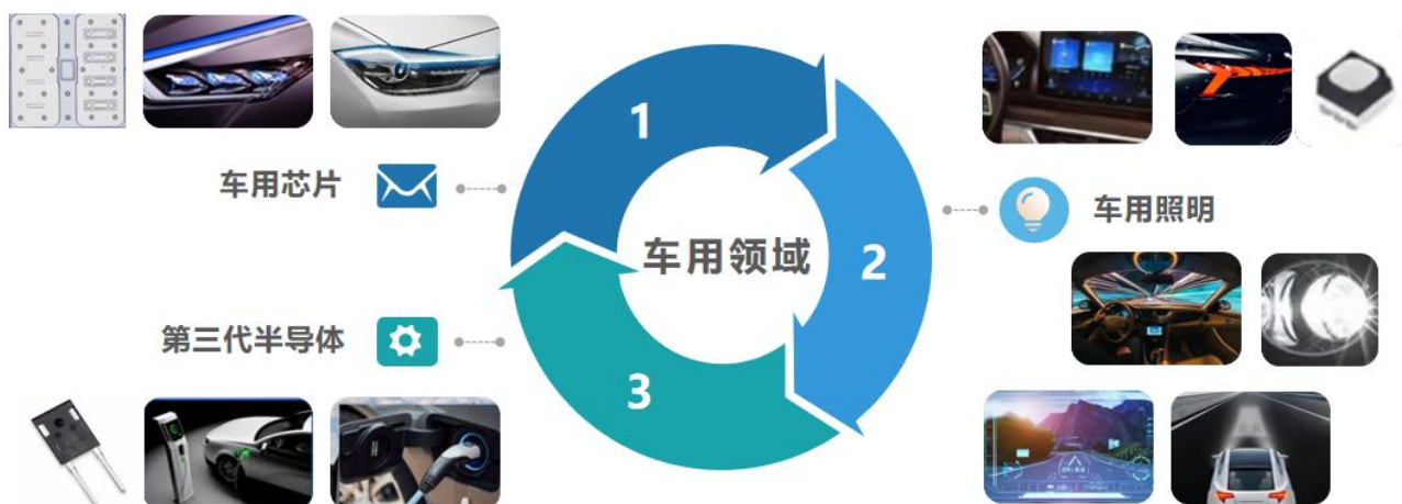
公司车用领域产品布局

2、 前瞻性布局方面 ，公司围绕 Mini/Micro LED、第三代半导体、车载器件等多个新兴领域，不断攻克技术难关，强化前瞻成果转化。积极开发应用于 \leq P1.0 超小间距显示屏的新型 MIP 封装架构，成功 推出 MIP 系列新品 ，有效解决了成品良率、成本、显示效果三大目前制约 Micro LED 发展的问题，推动 Mini/Micro LED 规模化商用进程提速； 布局“元宇宙”终端设备 AR 眼镜新兴显示技术 ，开发出 0.39 寸单绿色 Micro LED 微显示屏成功实现点亮； 第三代半导体方向全新推出 SiC-MOS 1200V 系列产品、SiC-SBD 650V/1200V 产品、GaN-FET 650V 分立及集成化系列产品和 NSEAS 系列功率模块 ，其中车载功率器件 SiC-SBD 1200V10A 器件获 AEC-Q101 车规级认证。