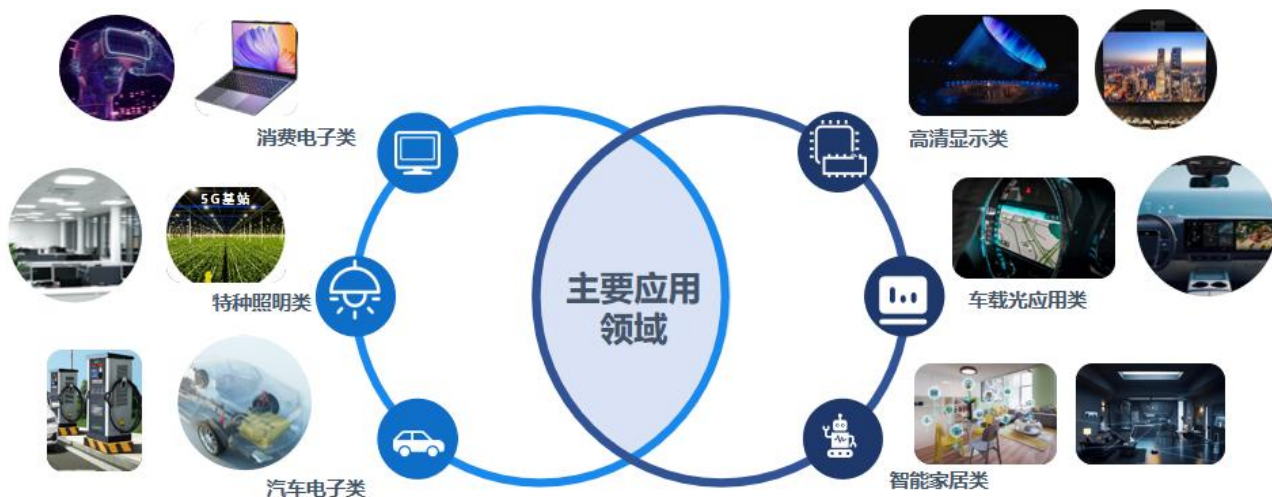
公司产品主要应用领域

1、 高清显示方面 ，围绕虚拟拍摄、数字影视等高端显示领域推出 RS-2727MWAT、RS-C1515MBAM 等系列产品，其中 RS-C1515MBAM 产品满足数字电影技术色域要求，在显示的视觉冲击上实现新突破； 高端照明方面 ，优化健康照明全光谱方案，高端商照产品光效性能提升 5%； 新能源汽车领域 ，公司加快市场开拓，开发车用抬头显示 HUD 器件，车灯 LED 成功切入主机厂，陶瓷 2016 闪光灯等多款高端产品成功进入国内头部终端品牌，智能交互器件成功进入国内高端品牌； 消费电子智能穿戴领域 ，完成 1816 系列感测器件的升级，通过大幅提升能耗、亮度等核心性能进一步扩大应用领域； 集成电路封测产品 进入车用模拟、户外储能等新型应用领域；Micro 芯片工艺完成定型，为开辟新赛道新产品夯实基础。