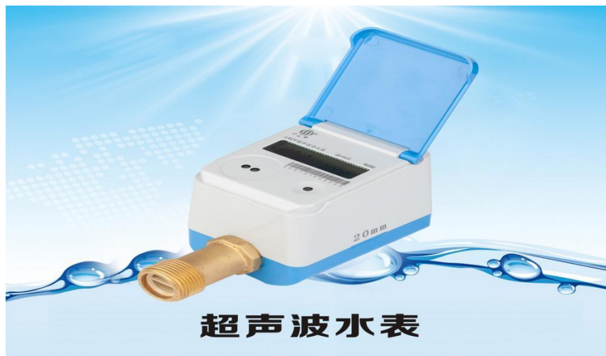
多感知超声波水表

③多感知超声波水表。多感知超声波水表是基于 5G 通信技术，能实时感知水量、水质、水压、水温等多种参数的一款水表。其主要特点：（1）超声波计量，计量精度高并可计量正、逆向流量；（2）集成水质传感器、温度传感器、压力传感器，可实时判断当前水质的优劣，对超低或超高水温进行预警，对管网压力进行检测，及时发现爆管或渗漏事故；（3）数据海量存储，可循环存储 120 月结数据、120 天日结数据、50 条故障记录、2000 条事件记录；（4）产品具有红外通讯接口，接受固件升级，也可通过通信网络实现远程升级。