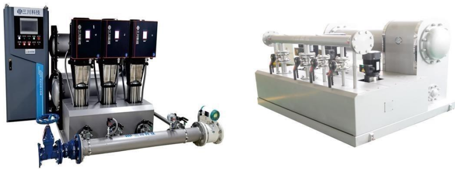
无负压供水设备实物照片

⑤智慧水务管理平台（“云智联平台”或“云平台”）。智慧水务管理平台是一个信息化、数字化、智慧化的水务移动互联网+SaaS 服务平台，融合微服务架构、云原生、前后端分离等核心技术，集成物联网、水务业务管理、数据可视化、大数据分析、数据挖掘及应用一体化的全生态管理平台。该平台以“NB”水表等智能终端为抓手，以物联网、移动互联网、大数据等新一代信息技术为手段，建设国内领先的信息基础设施，成熟稳定的业务应用，灵活多样的便民服务手段，打造面向公众需求的民生服务应用体系，健康有序地推动水务行业智慧化建设。智慧水务云平台可兼容不同类型、厂商、协议的设备，包含水表、集中器、水质监测、二次供水、智慧能源等物联设备，帮助水司消除烟囱式系统和数据孤岛，实现生产调度（水质管理、二次供水）、客服营销（智能抄表和收费系统）、运营管理（移动办公、工单管理）和定量控漏（DMA 分区计量、渗漏预警管理、压力监控管理）四大功能。