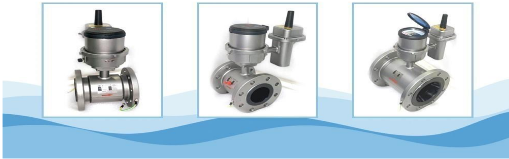
电磁水表实物照片

③多感知超声波水表。多感知超声波水表是基于 5G 通信技术，能实时感知水量、水质、水压、水温等多种参数的一款水表。其主要特点：（1）超声波计量，计量精度高并可计量正、逆向流量；（2）集成水质传感器、温度传感器、压力传感器，可实时判断当前水质的优劣，对超低或超高水温进行预警，对管网压力进行检测，及时发现爆管或渗漏事故；（3）数据海量存储，可循环存储 120 月结数据、120 天日结数据、50 条故障记录、2000 条事件记录；（4）产品具有红外通讯接口，接受固件升级，也可通过通信网络实现远程升级。