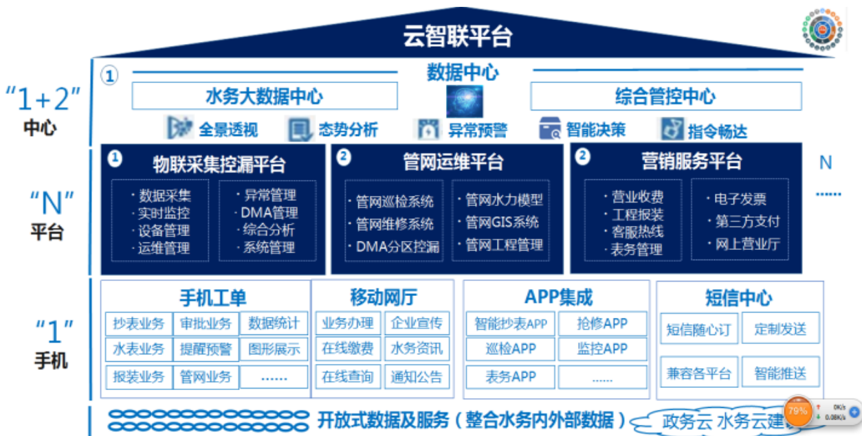
智慧水务云平台架构图

⑤智慧水务管理平台（“云智联平台”或“云平台”）。智慧水务管理平台是一个信息化、数字化、智慧化的水务移动互联网+SaaS 服务平台，融合微服务架构、云原生、前后端分离等核心技术，集成物联网、水务业务管理、数据可视化、大数据分析、数据挖掘及应用一体化的全生态管理平台。该平台以“NB”水表等智能终端为抓手，以物联网、移动互联网、大数据等新一代信息技术为手段，建设国内领先的信息基础设施，成熟稳定的业务应用，灵活多样的便民服务手段，打造面向公众需求的民生服务应用体系，健康有序地推动水务行业智慧化建设。智慧水务云平台可兼容不同类型、厂商、协议的设备，包含水表、集中器、水质监测、二次供水、智慧能源等物联设备，帮助水司消除烟囱式系统和数据孤岛，实现生产调度（水质管理、二次供水）、客服营销（智能抄表和收费系统）、运营管理（移动办公、工单管理）和定量控漏（DMA 分区计量、渗漏预警管理、压力监控管理）四大功能。