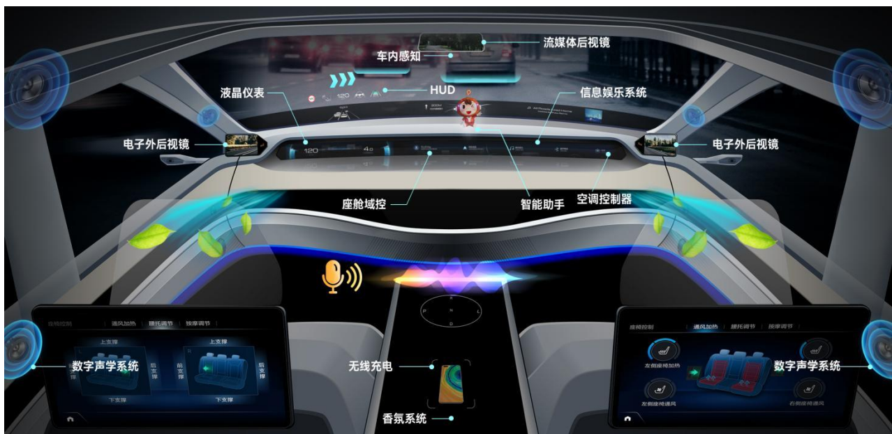
公司汽车电子业务智能座舱产品应用场景示意图

在智能驾驶及智能网联领域，公司依托高性能计算平台、多传感器融合、驾驶辅助控制算法以及智能网联技术，从低速（泊车）场景向高速（自动驾驶）场景布局，提供人-车-路-云协同的智能驾驶解决方案，打造安全便捷的用户驾乘体验。