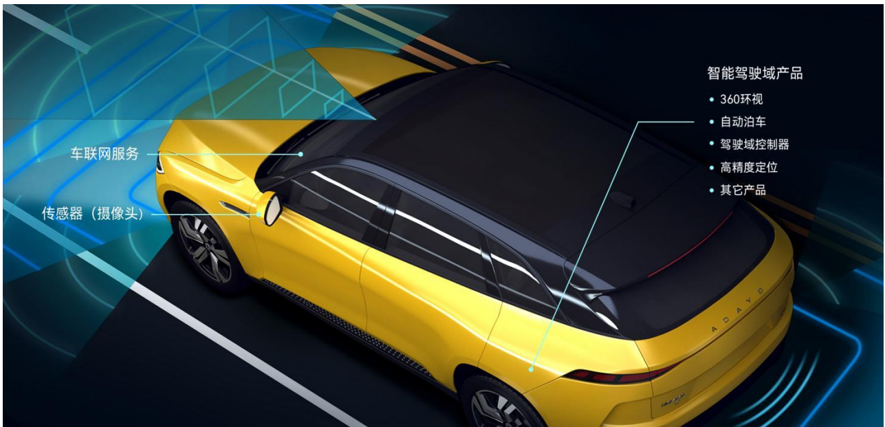
公司汽车电子业务智能驾驶及网联产品应用场景示意图