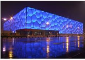
项目名称： 国家游泳中心（水立方） 选用科顺股份材料： 丙烯酸型高聚物水泥弹性防水涂料