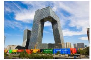
项目名称： 中央电视台新台址 选用科顺股份材料： 高聚物水泥弹性防水涂料

公司是中国建筑防水协会副会长单位，为行业协会认定的建筑防水行业综合实力前三强企业，2013年至2023年连续11年在中国房地产研究会、中国房地产业协会、中国房地产测评中心评选的中国房地产开发企业500强首选供应商（防水材料类）中排名第二，截至2023年3月31日，公司参与编制国家、地方或行业标准等文件超过60项。