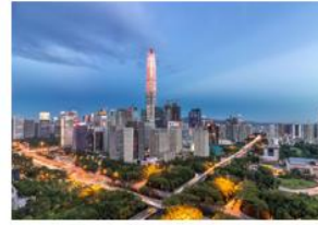
项目名称： 深圳平安金融中心 选用科顺股份材料： 蠕变型橡胶沥青防水涂料 高聚物改性沥青耐根穿刺防水卷材