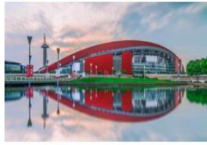
项目名称： 南京奥体中心 选用科顺股份材料： 自粘聚合物改性沥青防水卷材 丙烯酸型高聚物水泥弹性防水涂料