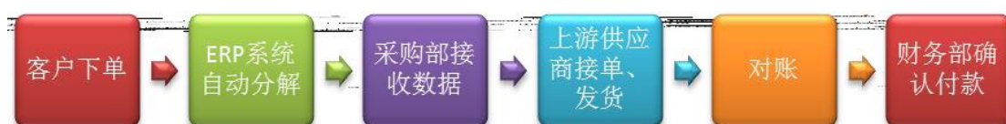
原材料采购下单流程

公司建立严格的原材料供应商备选制度，对原材料供应商的服务、规模、交货能力以及价格进行综合考评。公司原材料采购下单由微软ERP系统自动生成。销售部门接到客户订单后，ERP系统根据内部生产表设定原材料采购数量，并自动将数据分解后送至采购部，由采购部联系上游供应商下单。目前采购部门人员配备完善，工作职责定位清晰。在供应链管理方面，建立在双方信任和紧密合作的前提下，公司要求某些特定材料的供应商建设HUB仓制度（即原材料预先存放在公司的仓库，领用材料时才视同提货）。公司通过订单系统将建立HUB仓制度的原材料的日存货数据每日整理提交供应商，原材料供应商则根据HUB仓剩余的材料数量下达发货指令。HUB仓制度在采购流程上与普通采购流程无大差别，但在生产中更加有利于公司原材料提用和生产顺利进行。目前，采用HUB仓模式的主要是主材FCCL、屏蔽膜、化学品和部分通用元器件的供应商。