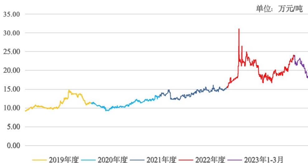
金属镍市场价格走势图