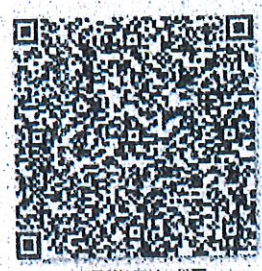
到原单位的年检二维码

本证书经检验合格，继续有效一年。 This certificate is valid for another year after this renewal.