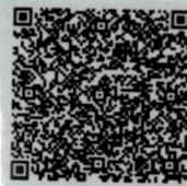
李磊明年检二维码

本证书经检验合格，继续有效一年。 This certificate is valid for another year after this renewal.