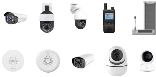
图 6：安徽赛达智能终端设备

互联网视频应用产品及服务业务上游厂商主要是硬件终端代工厂，以细分行业应用场景作为业务切入点，整合优质上游厂商产品及服务，通过硬件产品迭代更新、业务平台软件及视觉算法自主研发和不断优化，赋能运营商及其他合作伙伴，攻坚农业农村局、林业局、市监局、教育局、民政局等政府客户，助力政府实现信息化及数字化升级。同时，针对 C 端客户及小型企业，提供优质监控终端，协助运营商占领家庭终端及商客市场。