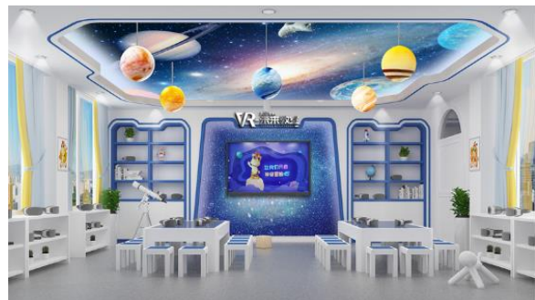
图 5：VR 未来教室效果图