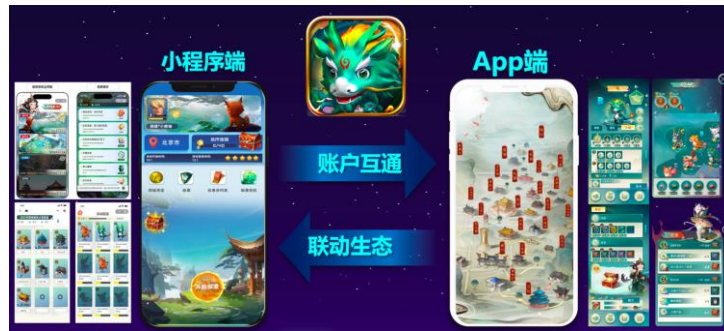
图 3：“探城”文商旅互动平台

“故宫以东”城市文化互动平台，是基于互动引擎技术，围绕东城区重要的古迹、故居、文物、景观、商业等内容进行数字化开发及虚拟线上转化，让用户能够参与大型城市联动平台中的文商旅融合产品。该项目将综合运用自由探索、瑞兽养成、互动权益等模式把东城的文化有机、有趣地串联起来。在北京市科学技术委员会孵化和东城区文旅局资源支撑与深度合作下，该课题顺利通过北京市科学技术委员会专家组验收。报告期内，基于“故宫以东”城市文化互动平台，同步持续开发“探城”文商旅互动平台。