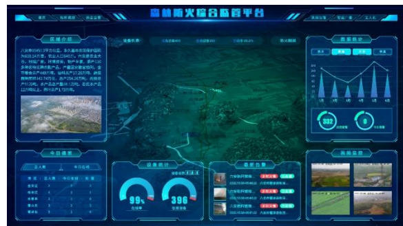
图 7：安徽赛达森林防火监管平台