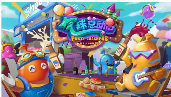
图 4：“Party Crashers: Balloons”（《气球总动员》）

VR 教育方面，基于目前素质教育市场的普遍需求，公司推出 VR 教育整体解决方案，通过提供硬件设备、软件系统、完整课程体系及培训运维服务，打造沉浸式、交互式的体验课堂。主要产品包括面向学前阶段用户的 VR 教育产品太空学院-VR 未来教室和太空学院-VR 科探区、面向中小学阶段用户的 VR 教育产品为红色 VR-爱国主义教育体验区。