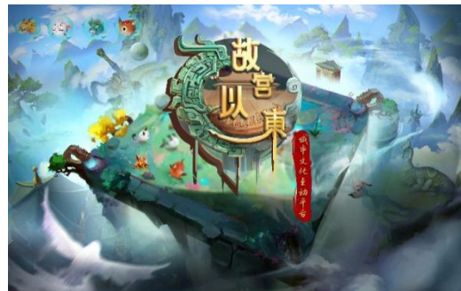
图 2：“故宫以东”城市文化互动平台地图界面