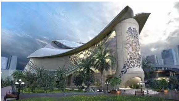
图 1：珠海横琴中医药科技创意博物馆项目实景图

LBE 城市新娱乐业务主要为客户提供从创意制作到实施建设的一站式服务。通过故事创意、场地游戏玩法设计、数字特效等内容创作以及特殊装置及设备、用户交互系统等研发制作提升主题场馆的内容表现力。公司根据客户需求提供整体方案设计服务、资源整合等服务。公司 LBE 业务包括珠海横琴中医药科技创意博物馆项目、北京市东城区文商旅融合项目“故宫以东”城市文化互动平台（“探城”文商旅互动平台）等。