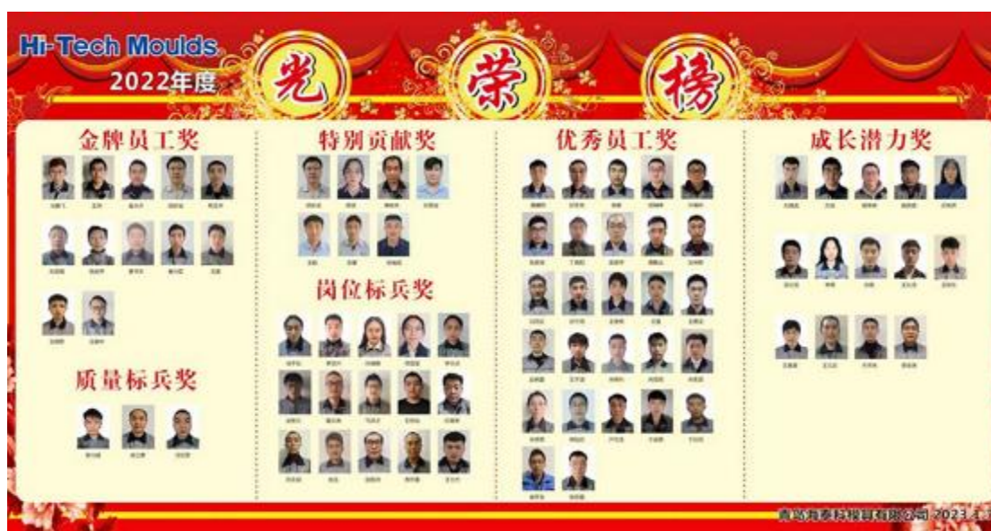
2022 年度公司表彰光荣榜