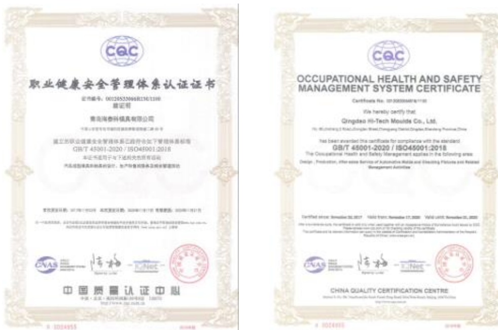
公司 ISO 45001 体系证书