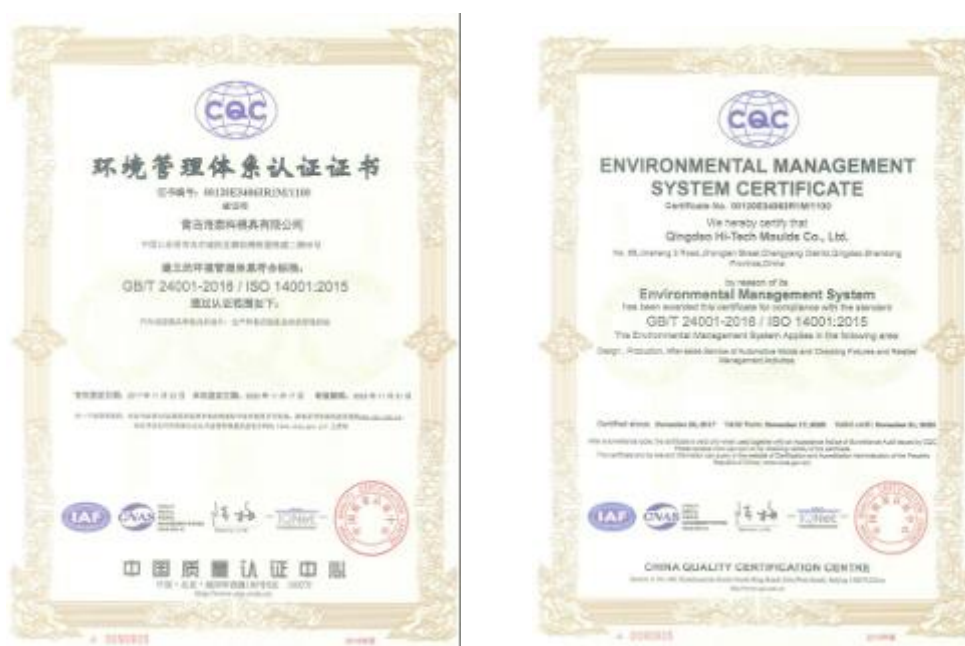
公司 ISO 14001 体系证书

为严格遵守法律法规包括《中华人民共和国环境保护法》及相关法规，本公司制定了《质量、环境、职业健康安全管理体系》、《资源、能源管理程序》，建立了符合 ISO14001 标准的环境管理体系，有效减少了生产及经营活动带来的污染物排放和资源消耗。本公司于 2017 年 11 月 22 日已取得 ISO14001 环境管理体系认证证书，并于 2020 年 11 月 17 日通过再认证取得新证书，有效期至 2023 年 11 月 16 日。