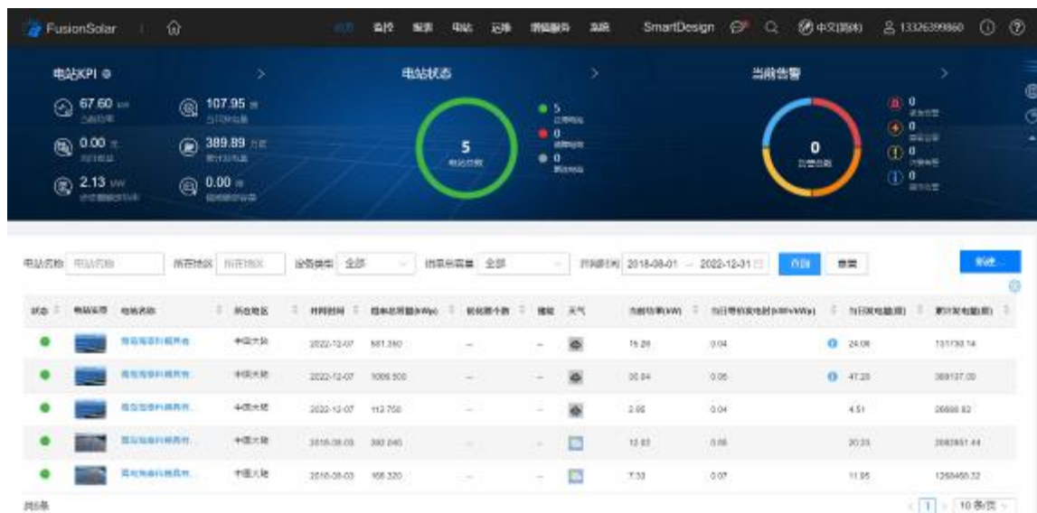
公司光伏发电站管理界面