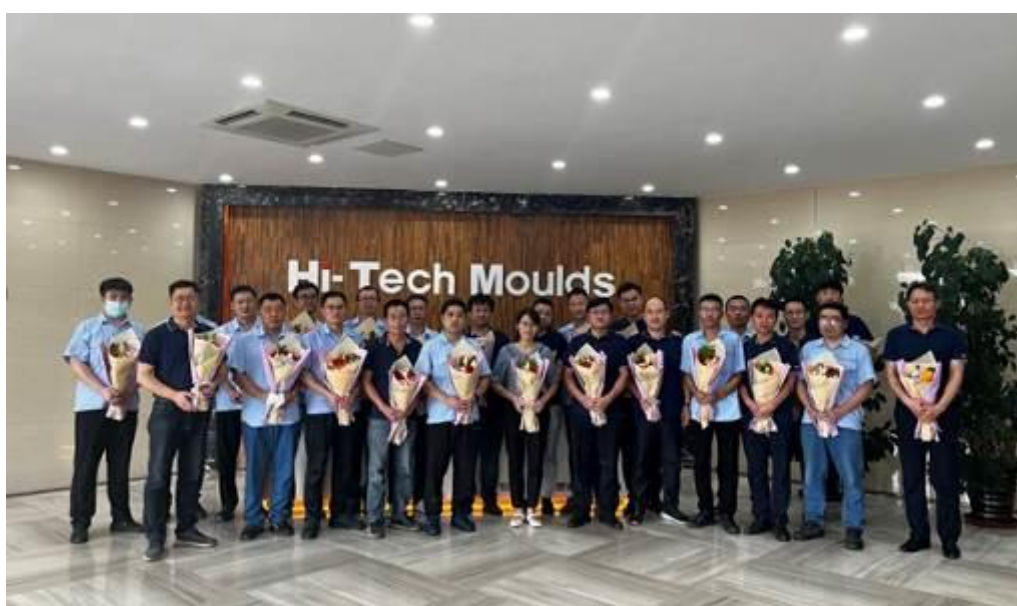
培训讲师教师节留影

报告期内，公司持续开展安全培训，通过安全三级教育以及安环部门根据公司风险识别制定的专项安全培训提高员工安全意识，增加员工应急处置知识，减少安全事故发生风险。岗位技能培训方面，公司在生产车间开展师带徒方式的员工技能培训，通过专岗技能课程的培训，配合定期考评，促进新员工的岗位技能提升。此外，针对非生产员工，公司也提供了与其岗位相应的培训计划，通过线上课程培训、专项培训等方式和渠道满足各部门员工培训需求。