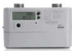
商业超声波燃气表