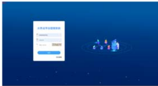
水务云客户管理系统