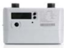
民用超声波燃气表

超声波计量仪表是利用超声波在介质中传递的时间差进行计量的新型计量仪表，它是一种高可靠性、高精度、带温压补偿的全电子式仪表。公司充分运用超声波计量技术精度高、易于实现智能化等特点，向运营商提供全电子一体化的先进计量解决方案，满足运营商对计量终端设备长期保持计量准确度的要求，凭借实时温度补偿、耐低温、宽量程等技术优势，改善运营商供销差问题，全面解决日常计量、用气安全监测、漏损监测等需要。