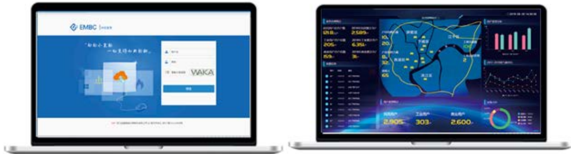
燃气云客户管理系统