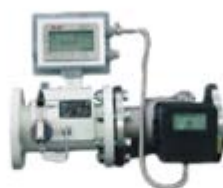
工业智能燃气流量计（控制器）