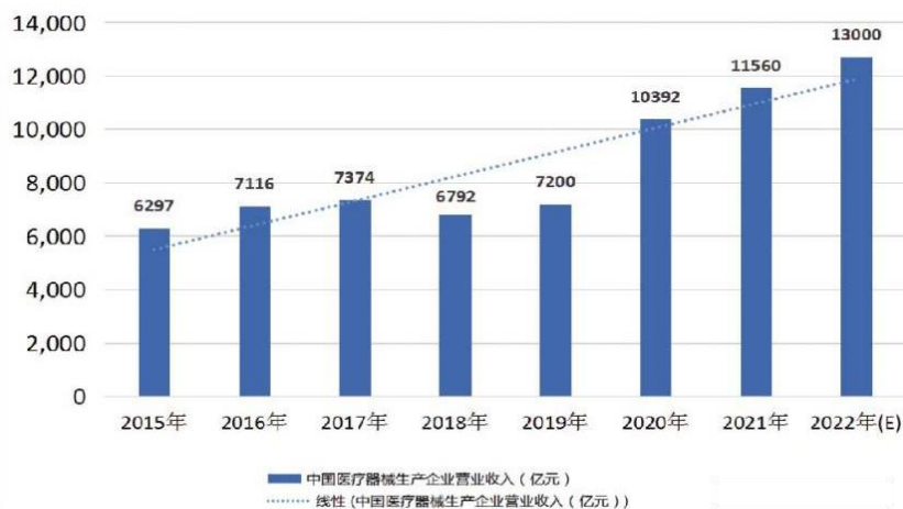
中国医疗器械生产企业营业收入及发展趋势

据南方医药经济研究所分析，中国已占据全球医疗器械市场 20% 以上的份额。2015 年至 2021 年，我国医疗器械产业营业收入年均复合增长率为 10.65%，2022 年预计增速达 12%，显著高于医药工业整体增速。