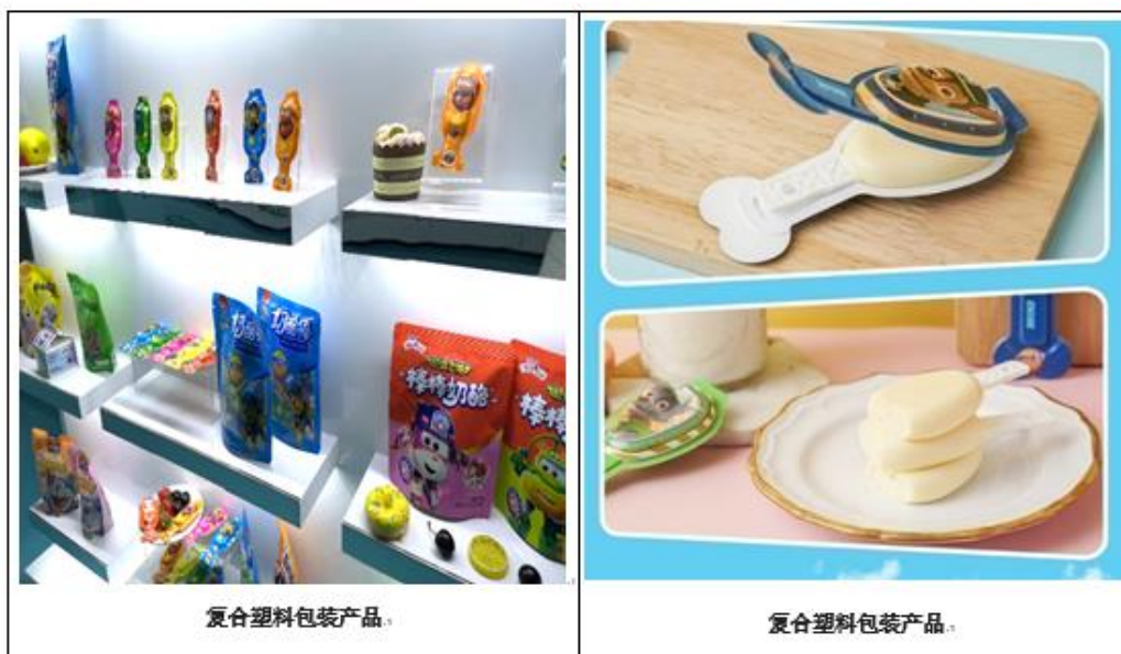
复合塑料包装产品。