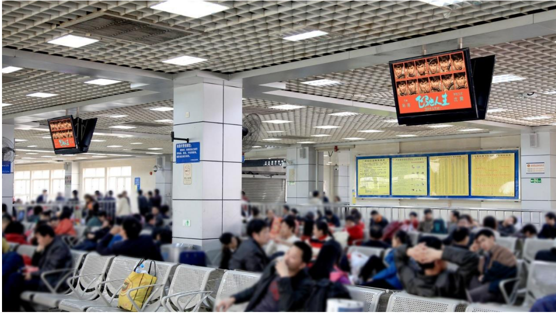
一体机广告（由一个电视视频机和一个数码刷屏机组成）