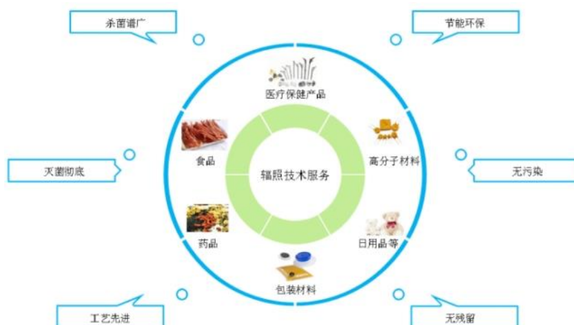
辐照技术服务主要对象和特点

公司主要从事辐照技术服务，为客户提供医疗保健产品、食品（包括宠物食品）、药品、包装材料等产品的辐照灭菌服务，高分子材料的辐照改性服务，隶属于民用非动力核技术应用产业，是中央企业中国黄金集团的七大业务板块之一。作为专业化灭菌服务企业，公司以辐照灭菌手段为主，同时发展多种技术手段，设有消毒供应中心主要为医疗机构及医疗器械厂商提供复用诊疗器械、器具及护理包、手术包的消毒灭菌服务。报告期内，辐照灭菌服务是公司最主要的收入和利润来源。