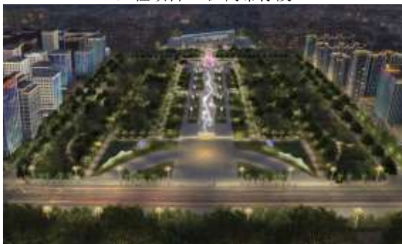
城市生态与人居环境改善治理项目 (节点改造及部分亮化) 设计-施工 EPC 工程总承包