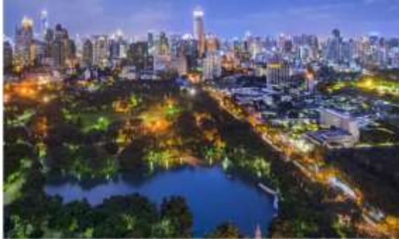
湖南华侨城千灯市集夜景照明工程