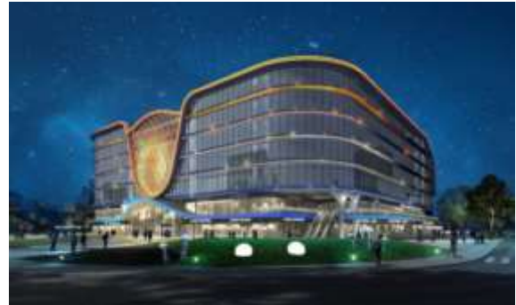
自贸区临港新片区 PDC1-0102 单元 C2 街坊 20-05 地块

(3) 公司承担的迪拜世博会“华夏之光”照明工程获得高度评价。作为2020年迪拜世博会“华夏之光”中国馆官方合作伙伴及主题灯光展演指定智慧光影系统服务商，公司承担了中国馆建筑“华夏之光”的相关照明设计、设备安装、运营保障等专业服务工作，为这一盛会注入了令人难忘的视觉盛宴。报告期内，公司所获迪拜世博会中国馆组委会发来的感谢信更是充分肯定了公司的专业服务水平和卓越的设计能力。感谢信高度赞扬了公司参与打造的“华夏之光”主题灯光秀，这一创意灯光展演精彩演绎了中国文化的创意和自信之美，向世界展示了“中国智造”的魅力和中国灯光设计实力，为中国馆圆满完成参展任务作出了重要贡献。公司的优秀技术和服 务不仅为世博会注入了活力和光彩，更体现了公司在智慧光影领域的专业实力和行业地位，为公司进一步拓展市场和提升品牌价值奠定了坚实的基础。