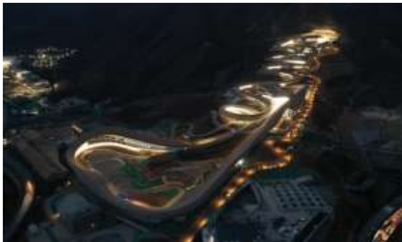
国家雪车雪橇中心赛道照明专业工程一标段