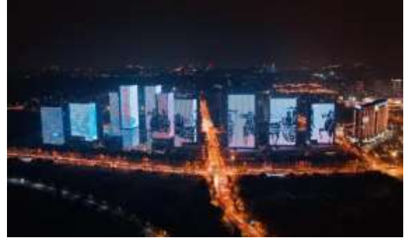
徐州金融集聚区延昆仑大道地块泛光照明工程