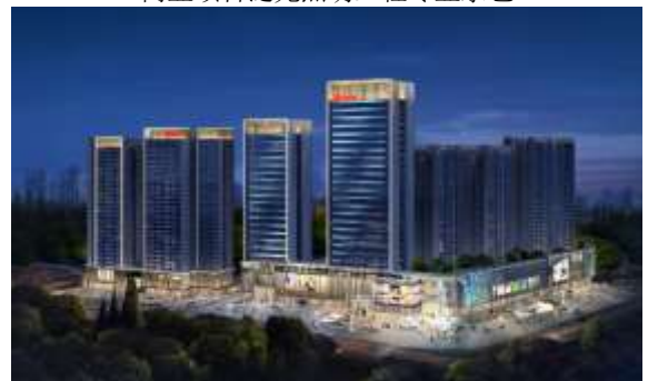
龙华区福城街道竹村城市更新单元项目