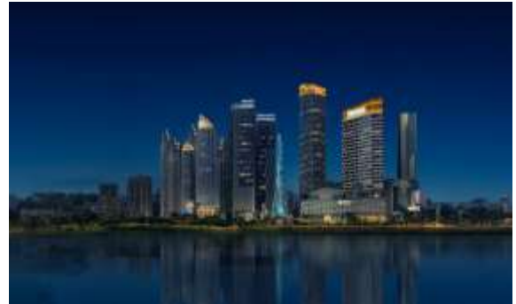
泉州市东海城东片区及晋江、洛阳江两岸照明提升工程（市 级国企投资部分）项目（包 4）