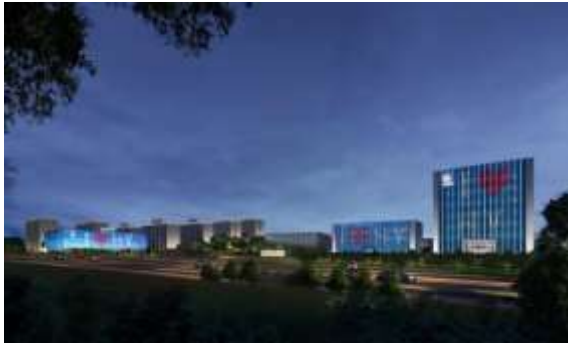
衢州钴新材料科创中心二期公寓、体育馆 泛光照明设计项目