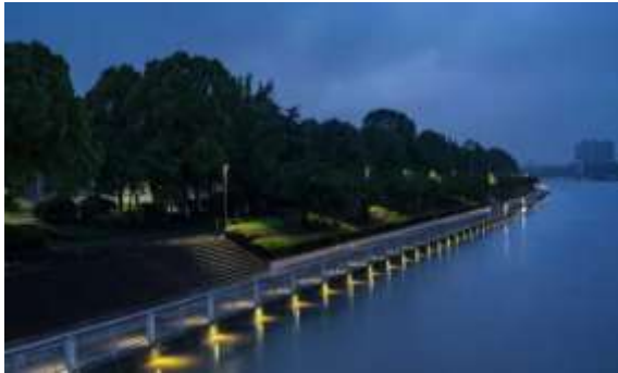
江山市城区亮化一期 工程项目-一江两带标段