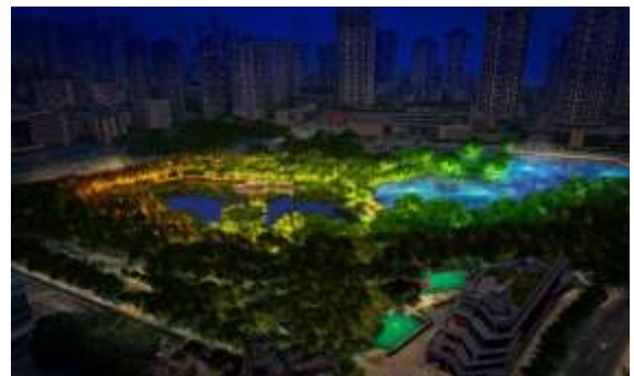
大渡口区公园照明提升工程总承包