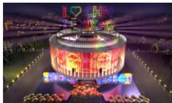
迪拜世博会“华夏之光”中国馆（俯视图）

(4) 智慧城域业务加速推进，HAO平台完成阶段性开发。HAO平台是以大数据为基础，以智慧科技为手段，为客户提供高品质保障的全流程服务平台。目前已完成物联网平台搭建，并已在智慧园区、智慧校园、智慧社区等项目中应用，公司将不断迭代升级HAO平台，持续完善物联网、HAO视频识别等平台搭建，构建智慧城域生态圈，与华为云、阿里云、腾讯、新华三等合作伙伴达成合作关系，秉承开放合作态度，协同产业上下游共同合作，通过产品共享、价值共享和能力共享赋能合作伙伴，携手合作伙伴一同为城市智慧化发展提供专业化服务。