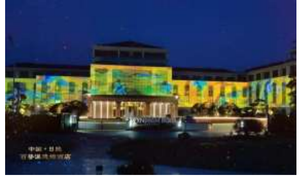
日照百替温德姆酒店智慧文旅夜游项目