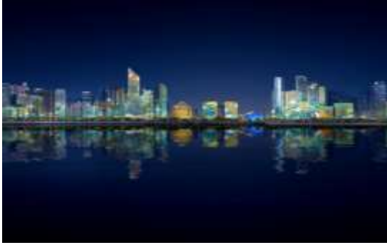
钱塘江北岸城市照明提升 (钱江新城段) 项目 EPC 总承包工程