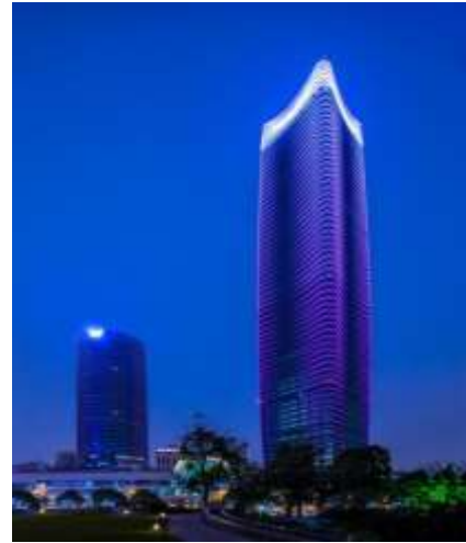
上海白玉兰广场办公类及展馆 照明灯具维保合同