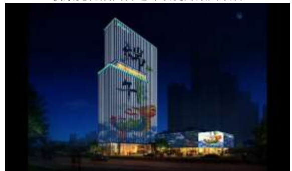
天都首郡二期地块项目 （黄山旅游大厦）泛光照明工程