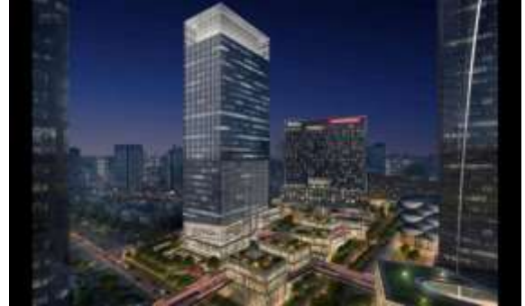
张江中区单元 56-01 地块项目泛光照明专业分包工程