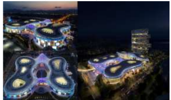
三亚国际免税城一期二号地 商业项目泛光照明工程专业承包