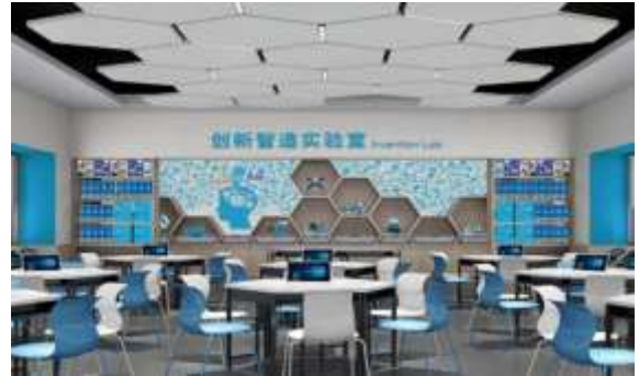
莱阳市人工智能创客教育中心建设项目