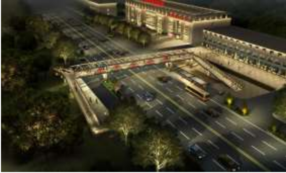
原平高速路口照明亮化工程项目