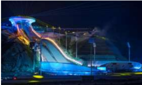
北京 2022 年冬奥会和冬残奥会张家口赛区张家口奥运村及古杨树场馆群建设项目-北欧中心跳台滑雪场（国家跳台滑雪中心“雪如意”）智慧照明系统及智慧夜游运营系统工程 EPC 总承包

(1) 助力冬奥会及冬残奥会的成功举办。北京 2022 年冬奥会和冬残奥会是我国主办的又一次具有重大意义的国际体育赛事。公司凭借着扎实的基础和过硬的专业能力，参与了国家跳台滑雪中心“雪如意”、国家雪车雪橇中心“雪游龙”、首钢滑雪大跳台“雪飞天”等冬奥场馆的建设，助力国家游泳中心“冰立方”、国家速滑馆“冰丝带”、国家体育馆、国家冰球馆、首都体育馆、云顶滑雪公园、冬奥会主媒体中心、北京冬奥村/北京冬残奥村、延庆冬奥村及延庆山地媒体中心、北京颁奖广场等多个场馆转播照明，为北京冬奥会及冬残奥会的全程赛时提供现场保障工作。公司秉持“绿色、共享、开放、廉洁”的理念，按照北京冬奥会组委会发布的《北京 2022 年冬奥会和冬残奥会低碳管理工作方案》部署，以低碳、绿色、智能为切入点，为项目量身定制节能灯具，减少碳排放，打造智慧照明系统及智慧夜游运营系统，建立智慧管理一体化平台，满足冬奥低碳场馆的要求。报告期内，公司及智慧城域公司收到北京 2022 年冬奥会和冬残奥会组织委员会北京冬奥村（冬残奥村）运行团队、张家口云顶场馆群运行团队、主媒体中心运行团队发来的感谢信，信中高度赞扬公司为场馆设施搭建、确保场馆安全及稳定运行、竞赛组织、服务保障、赛事转播和媒体工作等方面提供了强有力的支撑，高标准、高质量、高水平完成各项筹办及保障任务，以专业的职业精神奉献冬奥。北京冬奥会圆满兑现实现碳中和的承诺，成为迄今为止第一个“碳中和”的冬奥会，向世界展现了中国环保力量。未来，公司将继续紧跟国家步伐，践行“双碳”战略，积极推广低碳技术在智慧光影、智慧文旅、智慧城域、豪能汇新能源中的应用，助力碳中和城市建设。