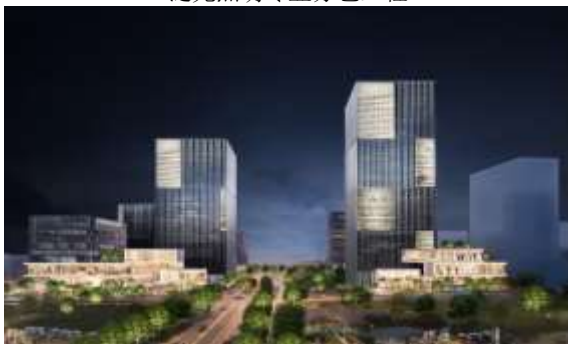
张江中区 76-02 地块项目泛光照明工程