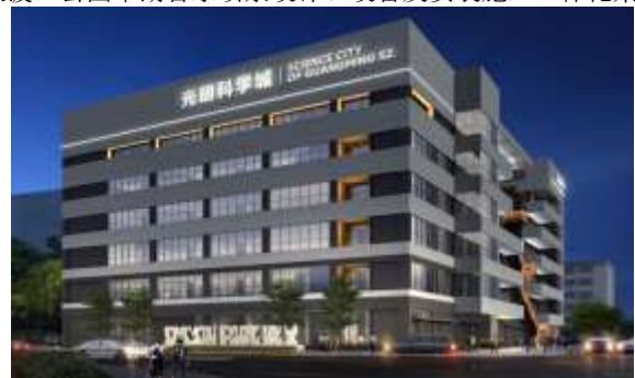
光明科学城重大科研项目过渡场地建设工程设计