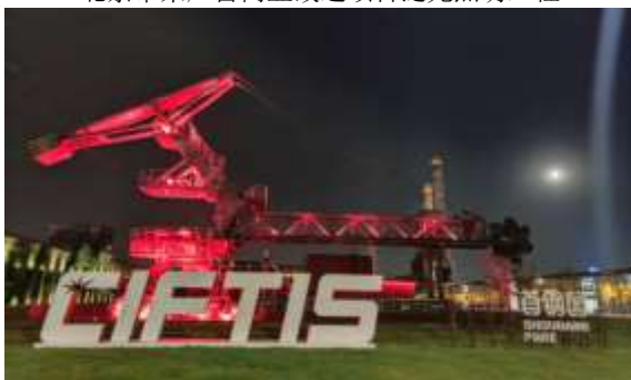
服贸会首钢园区场馆项目二期设计