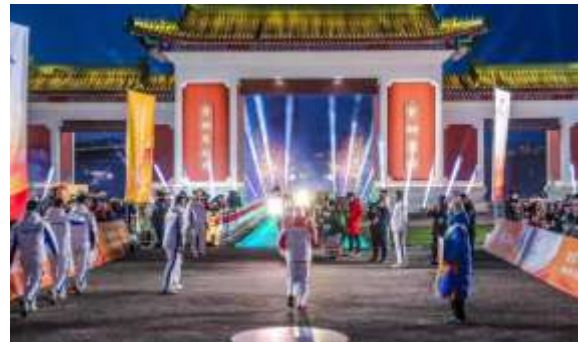
冬奥火炬接力活动照明设计

(2) 报告期内，公司完成和承接一批重点照明工程项目。公司承建的重庆白居寺长江大桥、江苏省省运会、重庆大渡口公园、海口市国际免税城、中国屏王“郑州眼”等项目相继亮相；西安国际足球中心、上海尚浦领世双子塔、陕西省“十七运”体育中心、上海张江新地标“科学之门”东塔、杭州钱江新城核心区项目、徐州金融集聚区、青岛西海岸海洋高新区核心区、安踏上海总部、黄山旅游大厦、泉州东海城东片区及晋江、洛阳江两岸、重庆巫溪城市绿色照明提升等项目陆续中标，体现了公司过硬的业内经验、技术优势和行业口碑，为公司进一步扩大市场提供了有力支持和保障。上述新增项目以及其他已承接的主要新增项目（含效果图）如下：