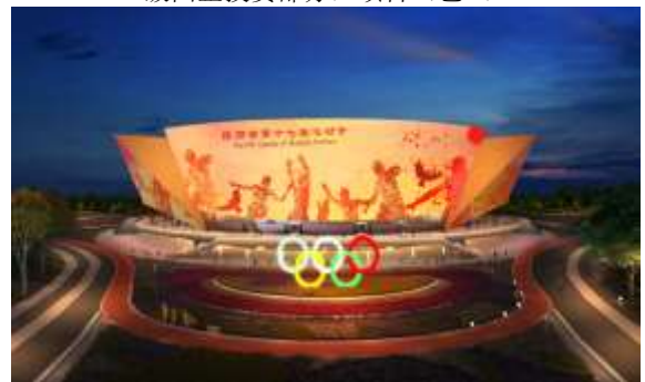
陕西省第十七届运动会体育中心 夜景亮化氛围营造专项提升采购项目