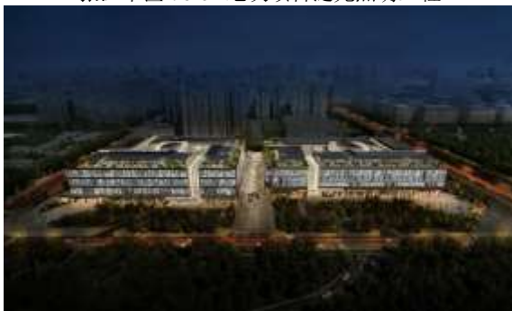
北京市来广营商业改造项目泛光照明工程