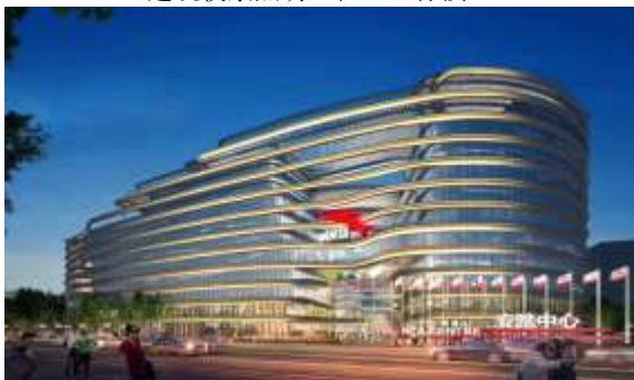
安踏上海总部项目泛光照明工程