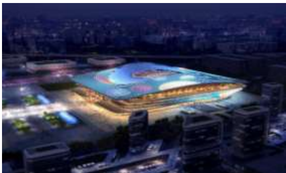
西安国际足球中心项目 EPC 工程 建筑夜景照明工程（一标段）