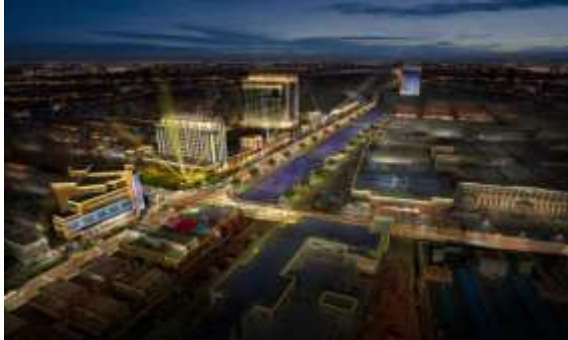
海洋高新区核心区营商环境完善工程