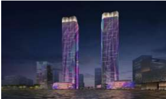
张江中区 58-01 地块项目泛光照明工程