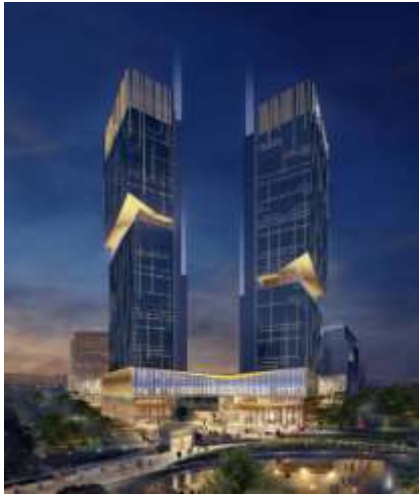
上海新江湾 F 区 F1-E 地块商办项目 泛光照明专业分包工程