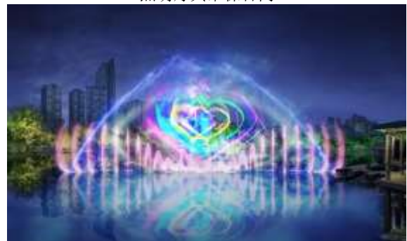
大渡口公园翠湖音乐喷泉设计、设备及安装施工一体化采购