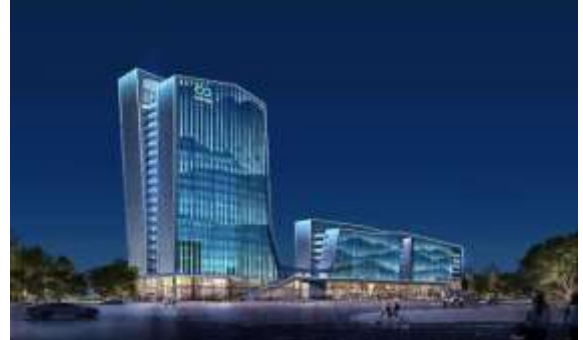
烟台国际节能环保科技园 绿色建筑 2.3 期泛光照明设计