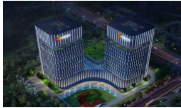
内蒙古呼和浩特生产调度指挥中心项目 夜景照明工程设计