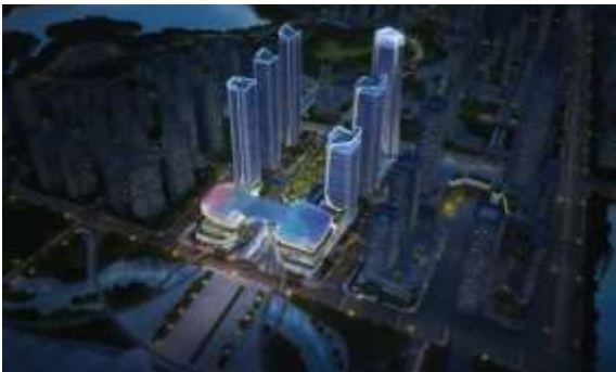
新建商务、商业设施、绿地与广场项目 (杨春湖启动区 A 地块) T2、T3 塔楼泛光照明分包工程