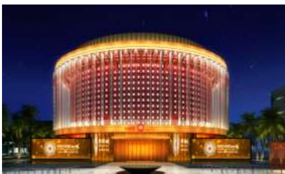
迪拜世博会“华夏之光”中国馆（平视图）

(3) 公司承担的迪拜世博会“华夏之光”照明工程获得高度评价。作为2020年迪拜世博会“华夏之光”中国馆官方合作伙伴及主题灯光展演指定智慧光影系统服务商，公司承担了中国馆建筑“华夏之光”的相关照明设计、设备安装、运营保障等专业服务工作，为这一盛会注入了令人难忘的视觉盛宴。报告期内，公司所获迪拜世博会中国馆组委会发来的感谢信更是充分肯定了公司的专业服务水平和卓越的设计能力。感谢信高度赞扬了公司参与打造的“华夏之光”主题灯光秀，这一创意灯光展演精彩演绎了中国文化的创意和自信之美，向世界展示了“中国智造”的魅力和中国灯光设计实力，为中国馆圆满完成参展任务作出了重要贡献。公司的优秀技术和服 务不仅为世博会注入了活力和光彩，更体现了公司在智慧光影领域的专业实力和行业地位，为公司进一步拓展市场和提升品牌价值奠定了坚实的基础。