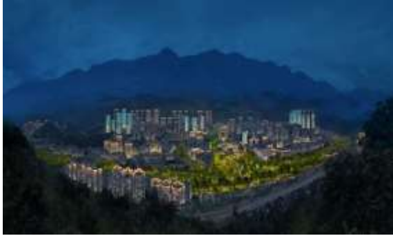
巫溪县城市绿色照明升级改造及基础设施 改造工程 EPC 总承包