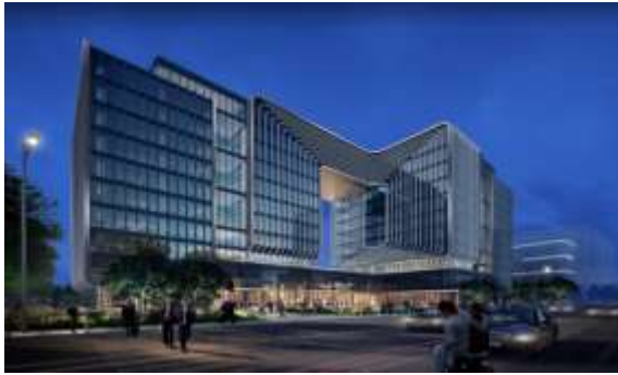
中国重燃研发总部基地项目夜景照明工程设计