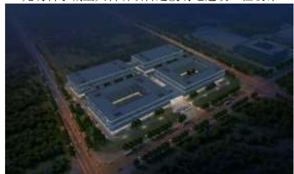
理想汽车产业园项目设计