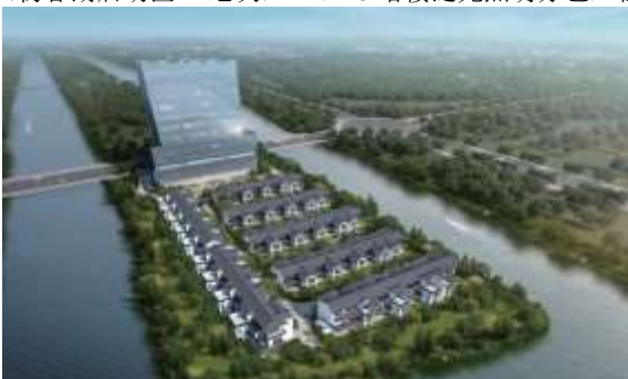
万全镇中心区 A53 地块智慧夜景工程施工项目