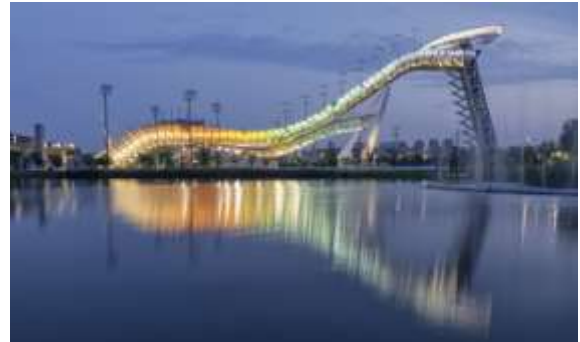
首钢滑雪大跳台中心项目