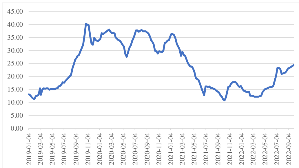
2019 年-2022 年 9 月全国 22 个省市生猪平均价格（元/千克）

我国生猪价格的周期性波动特征明显，一般 3-4 年为一个波动周期。报告期内，我国 22 省市生猪平均价格变动情况如下：