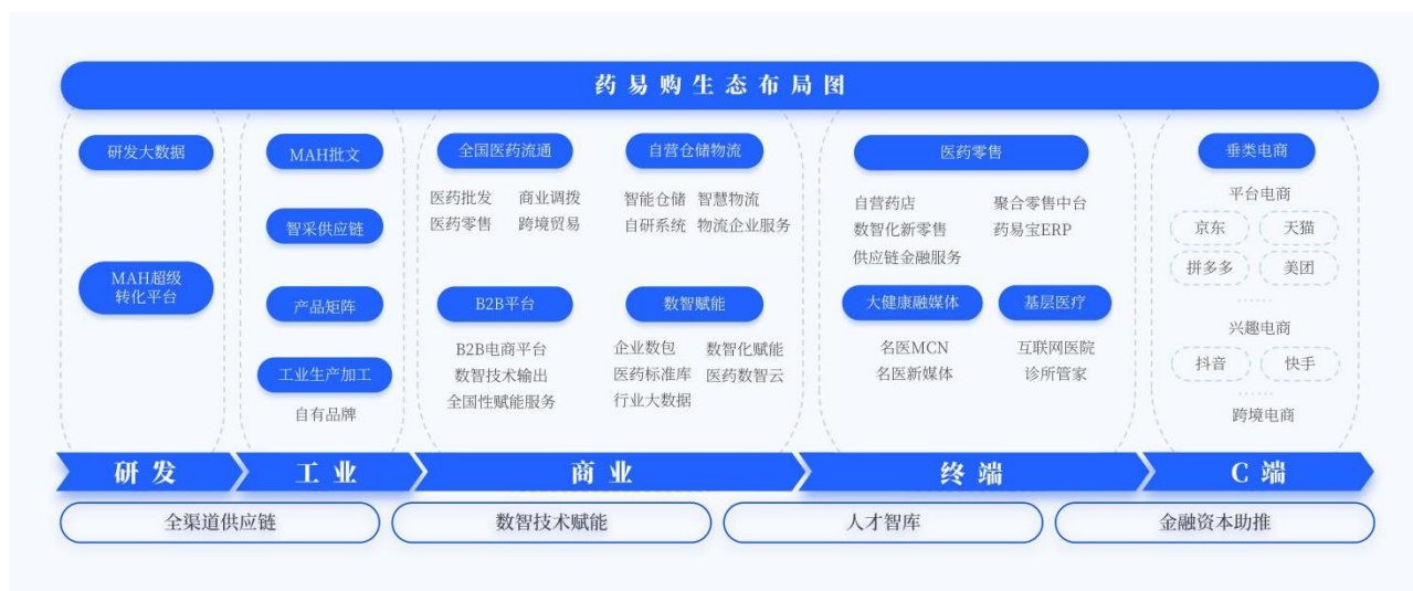
药易购产业互联网生态图

根据中国医药商业协会召开的“药品流通行业(2021-2022 年)信息发布暨发展形势报告会”，公司 2021 年药品流通行业批发企业主营业务收入排名第 41 位。2022 年公司被中华人民共和国商务部评选为国家级电商示范企业；公司当选中国医药物资协会 MAH 分会秘书长单位；公司被四川省商务厅、四川