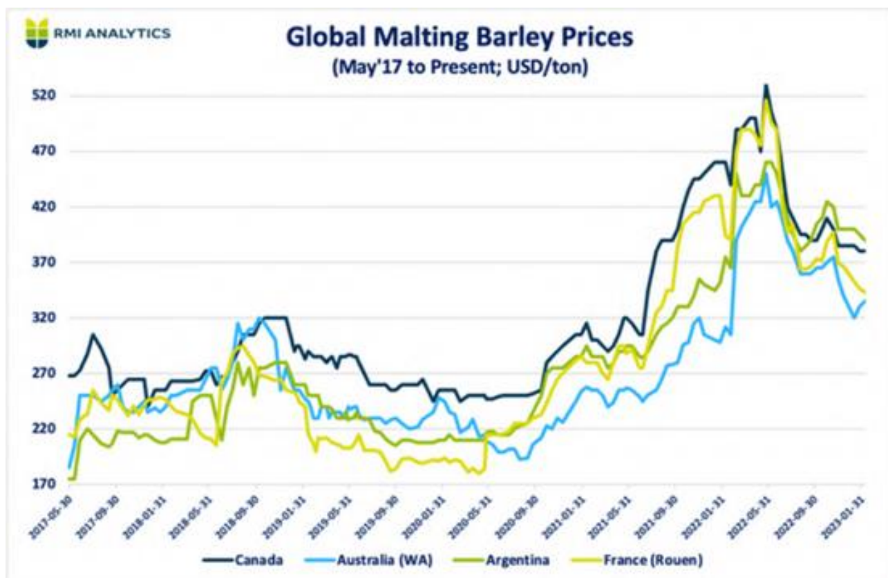
近年各产地啤酒大麦 FOB 价格趋势图

(2) 汇率波动导致进口大麦以人民币计价上涨。美国为抑制通胀对美元持续加息，导致中日欧等国货币对美元汇率贬值且大幅波动，而公司采购大麦主要以美元计价，因此导致以人民币计价的进口大麦价格上涨。