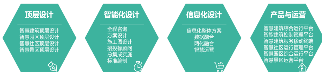
延华智慧城市与云平台业务全生命周期管理和运营

在数字中国和城市全面数字化的背景下，公司立足于数字化转型，深入研究新型技术架构、智慧大脑、智慧中台、新一代信息技术和产品应用、创新场景在建筑的应用，在大型城市综合体、大型公建、智慧医院、数据中心、超高层建筑、星级酒店、智慧校园、智慧社区等建筑细分领域持续发力，为城市及建筑提供从顶层设计与咨询、智能化设计、信息化设计、平台运营，全生命周期的解决方案；助力解决城市运营、管理提供城市智慧运行、统一管理和精准服务等发展过程中的疑难问题，助力城市数字化转型、提高城市运营管理服务水平、提升产业发展质量和市民生活幸福感，增强城市综合竞争力。