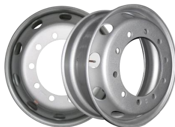
图2：轻量化无内胎钢轮（适用于轻量化商用车型）