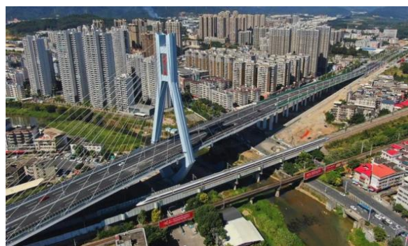
图10：NCC钢结构应用于公路跨线桥