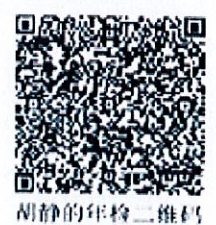
胡静的年检二维码

证书编号: 110001540461 No. of Certificate 批准注册协会: 广东注册会计师协会 Authorized Institute of CPAs 发证日期: 2012 年 09 月 18 日 Date of Issuance