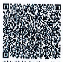
证书的年检二维码