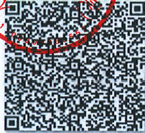
每年的年检二维码