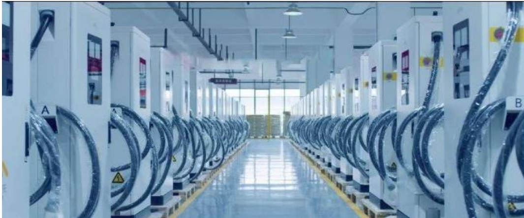
图：公司充电桩生产车间

报告期，万马新能源充电设备对外销售发出同比增长39.13%，随着充电桩销售量的不断提升，代运营、代运维等业务也逐步扩大。