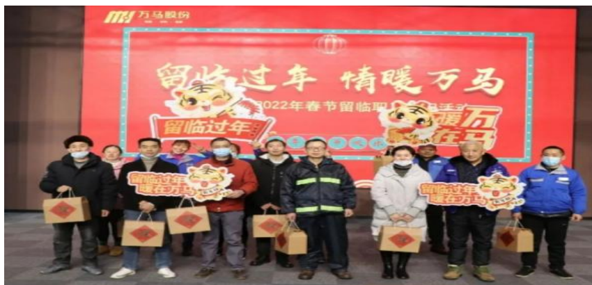
图：为外地员工欢度新春，工会精心筹备，开展迎新春送温暖活动

公司与全体员工签订劳动合同并按规定履行，缴纳社会保险，享受规定假期。公司统一建立合理的考核制度，建立健全有效的激励约束机制，通过科学有效的薪酬管理提高企业的竞争力，充分调动各级员工的积极性，将公司利益和员工利益紧密结合起来，坚持业绩为导向，鼓励能力提升。完善了公司的培训体系，为公司团队人才培养和人才梯队建设，提供了全方位的支持，同时提升了员工个人的综合素质。公司加大企业文化建设的推动，构建企业与员工的桥梁，加强员工的归属感、责任感。同时持续提高员工福利待遇，全方位推进健康体检、节日慰问、探望生病员工。对员工的成长给予更大的支持。