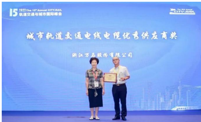
图：公司获城市轨道交通电线电缆优秀供应商奖

公司严格控制产品质量，对产品品质要求精益求精。优良的品质赢得客户的信赖，公司始终践行以客户为中心的理念，将客户需求放在首位，用过硬的产品质量、专业的销售服务、周到的售后服务赢得客户的肯定，被中国质量检验协会认定为“全国质量诚信标杆企业”、“全国电线电缆行业质量领先企业”和“全国产品和服务质量诚信示范企业”。为了给广大客户提供良好的服务，在 2022 年第十五届轨道交通与城市国际峰会上，公司荣获“松睿奖”城市轨道交通电线电缆优秀供应商奖。