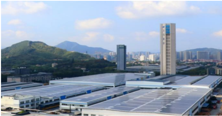
图：临安厂区 20 兆瓦屋顶分布式光伏电站

在国家大力发展低碳经济的背景下，公司坚持绿色低碳发展理念，自觉承担降碳主体责任，将“绿色制造、低碳环保”贯穿于企业经营循环。2022年，公司临安厂区20兆瓦屋顶分布式光伏电站并网投用，为实现“碳达峰”“碳中和”长期目标助力。