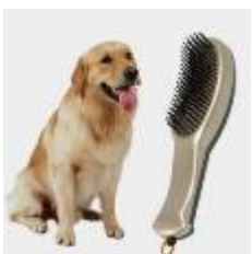
宠物刷子 (9) 宠物饮食产品

清洁护理用品主要用于宠物的方便、清洁打理及护理等，同时兼具除臭、安全舒适等特性。公司清洁护理用品的典型示例如下：