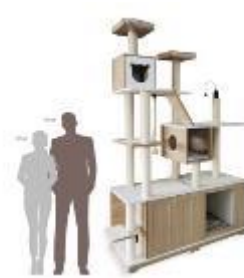
一体式家居猫别墅