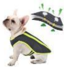
抗菌户外服饰 (7) 牵引出行用品