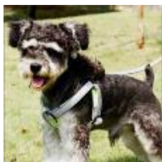
户外牵引带 (8) 清洁护理用品