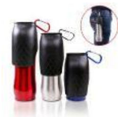
宠物水杯 (10) 宠物套装产品

宠物饮食产品主要包括宠物的饮食饮水用具以及宠物粮食、零食等，此类产品具有适用性、安全性、可持续性和以宠为本的特点。公司宠物饮食产品的典型示例如下：