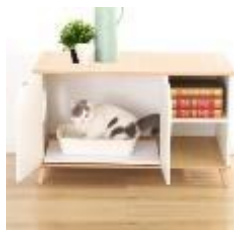
人宠小柜 (三) 经营模式

人宠结合产品主要实现养宠家庭节约空间、一器多用、人宠互动等功能，同时兼具造型美观，设计感强等特性。公司人宠结合产品典型示例如下：