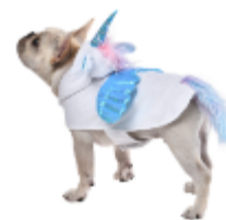
独角兽主题角色服

牵引出行用品主要用于宠物的出行、户外活动及户外近身控制等，满足宠物出行及户外防护的需求。