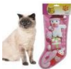
圣诞主题套装 (11) 主题系列产品