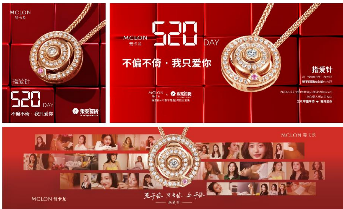
爆款产品线上线下渠道传播

报告期公司电商（线上业务）营业收入 61,379.62 万元，较去年同期增长 138.79%，线上收入占报告期营业收入的 38.12%，较去年同期提高 17.60 个百分点。