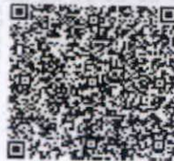
刘业美的年检二维码

本证书经检验合格，继续有效一年。 This certificate is valid for another year after this renewal.