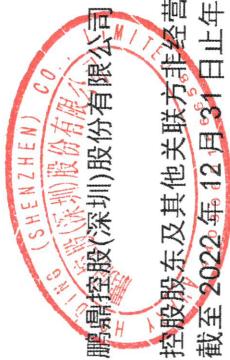
鹏鼎控股(深圳)股份有限公司 控股股东及其他关联方非经营性资金占用及其他关联方资金往来情况汇总表 截至2022年12月31日止年度