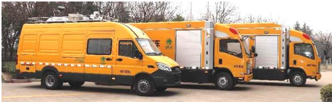
不停电旁路作业系统