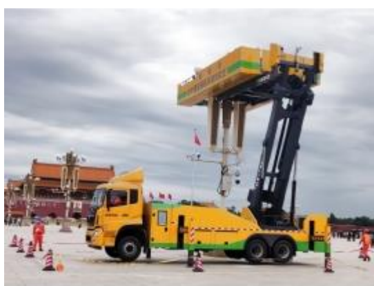
第五代华灯检修车

高空作业机械（专用车辆）定制产品包括华灯检修车、桥式架线车、线杆综合作业车、移动储能车、城市小型化机动电力应急抢修装备系列等。公司自主研发的第五代天安门华灯检修车平台可载重 2 吨，是普通高空作业车的 10 倍，平台展开后可满足 20 人同时作业，配置智能灯球自动清洗技术、智能监控指挥系统，被誉为“中华第一车”。城市小型化机动电力应急抢修系列装备，创新研发了全电驱动轮履复合的行走装置、单支撑升降结构、自动转向装置等，解决了设备行走的稳定性及涉水、爬坡、自动转向等问题；轻量化车身，实现了整车小型化、轻量化、车内配电设备的安全运行及全天候作业。解决城市地下配电场所及狭窄道路空间的不停电作业、提升作业效率和提高安全性能。