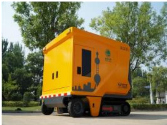
小型化履带式箱变车