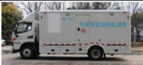
50-75kW 应急电源车（通讯行业使用较多）

主要介绍：本车型采用 5-10 吨专用汽车底盘上加装特制静音车厢，车厢内可配备 50-200kW 发电机组、控制柜、燃油箱、电缆及其卷盘等。主要适用于电力、通信、市政等应急供电保障作业工况，可快速对抢修抢建设施设备进行临时供电作业，作业时长可达 8 小时。