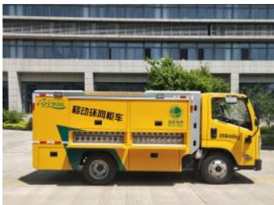
移动环网柜车（可进入地下室作业）