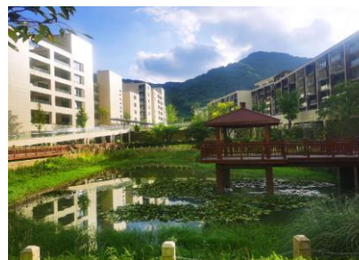
温州东方悦心中等职业技术学校