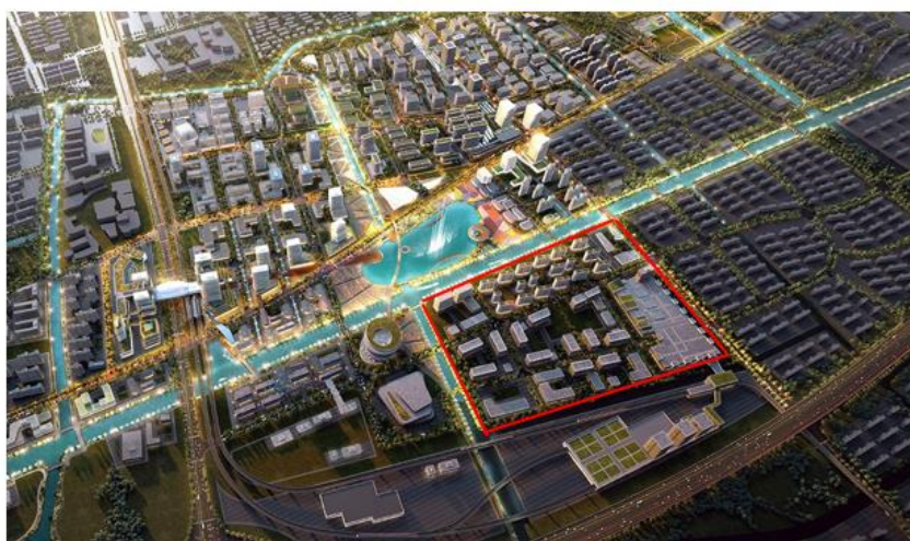
图：新浦江中心城市设计方案