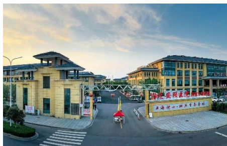
上海悦心·泗洪康养中心