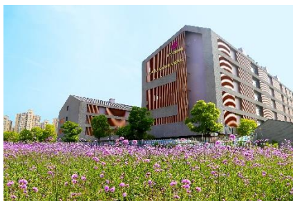
上海奉贤金海悦心颐养院

依托于悦心照护体系的完善和专业团队的壮大，“悦心·漫活欣成”、“悦心·安颐别业”、“悦心照护教育培训”三个产品线，互相支持、互为依托，形成齐头并进的发展态势。