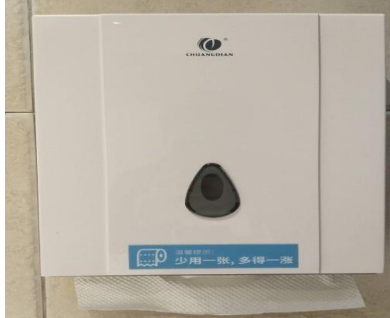
节约用水、用电、用纸宣传标识