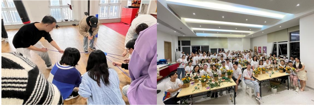
丰富多彩的员工活动

公司还特别重视员工的文化生活，员工在工作之余也能参加丰富多彩的文化活动。公司有阅览室、读书角等学习文化角，会为员工提供各类图书阅读、学习，同时，我们也会定期更新各类书籍和杂志，让员工持续学习、持续成长，变成更好的自己。