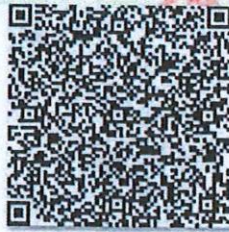
赖敦的年检二维码

本证书经检验合格，继续有效一年。 This certificate is valid for another year after this renewal.