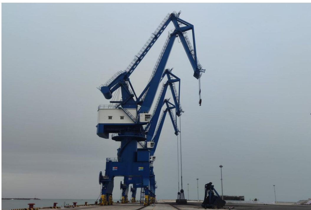
图 1 多用途门机图示