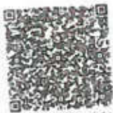
连续两年检二维码

本证书经检验合格。继续有效一年。 This certificate is valid for another year after this renewal.