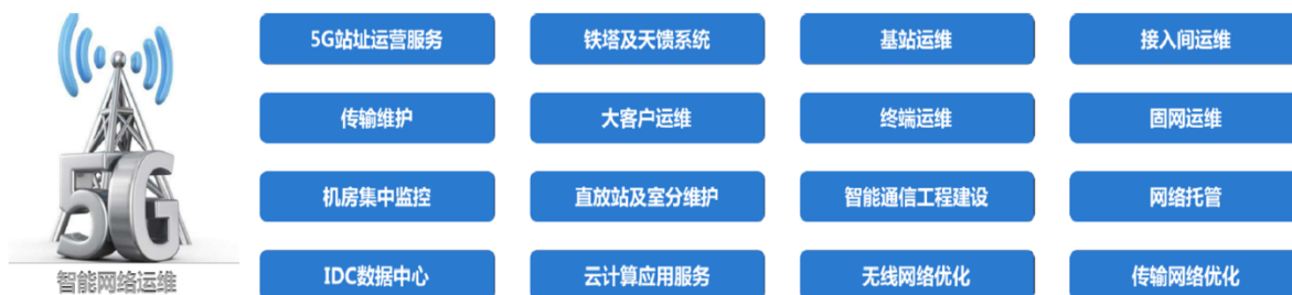
图表 长实通信业务介绍