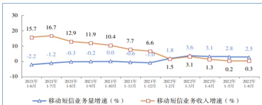
图表工信部短信行业数据

根据工信部披露的数据，移动短信业务收入低速增长。2022年上半年数据显示，全国移动短信业务量同比增长2.5%，移动短信业务收入同比增长0.3%，增速较一季度分别回落1.1和2.8个百分点。