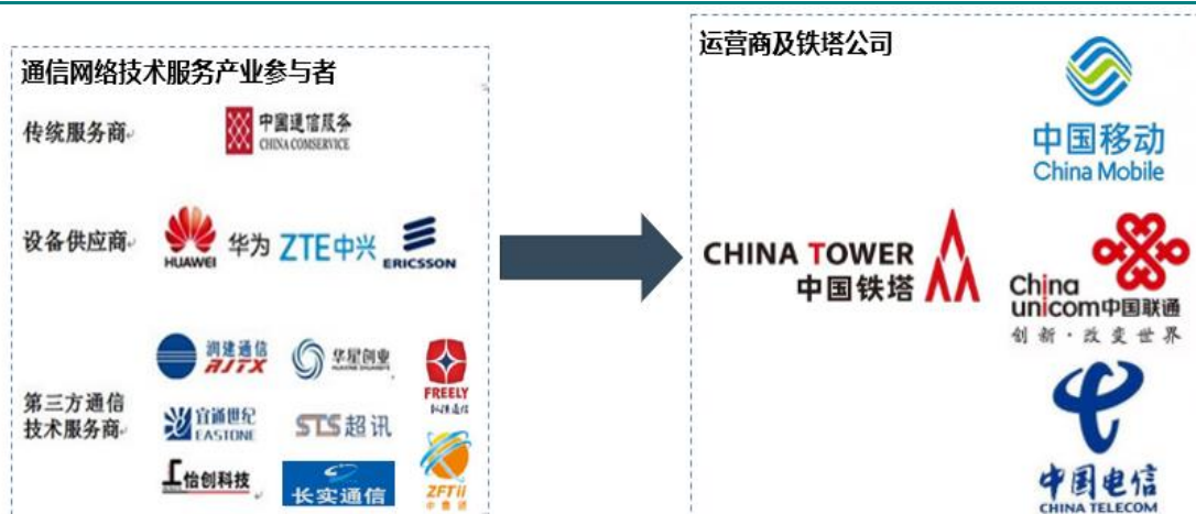
图表 通信技术服务产业链

通信网络技术服务产业：跟随运营商的资本投入，螺旋式上升。通信服务市场由传统服务商、设备厂商和第三方通信服务商组成。通信网络的建设与维护最早由运营商自行承担，不存在市场竞争。随着通信网络技术的不断升级、网络规模增大以及通信运营商对服务重视程度的提高，从事通信网络建设与维护的专业服务商不断涌现。