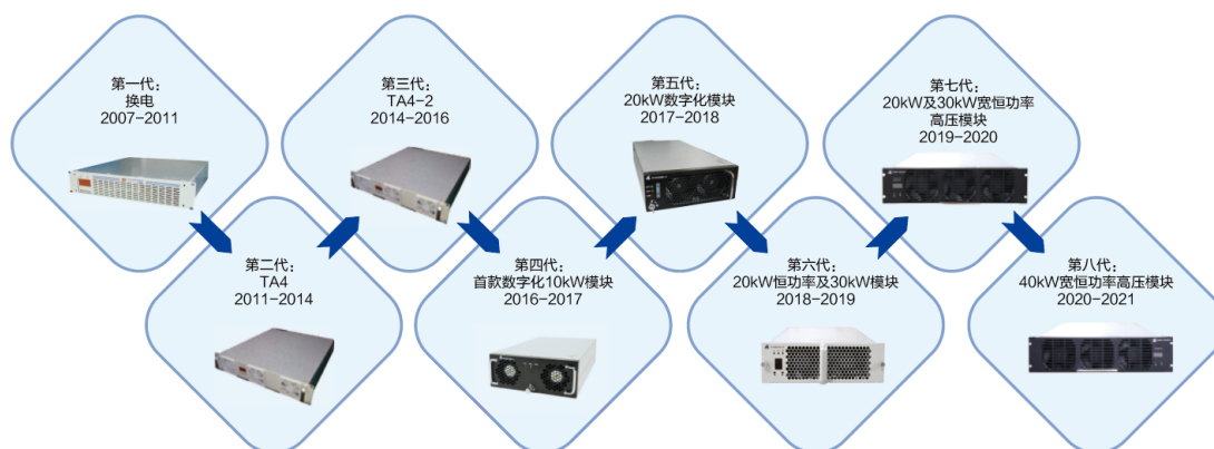
图 2 公司充电模块产品八代更迭示意图

③车载电源主要包含两类产品：车载充电机 OBC 和车载 DC-DC 转换器，其中车载充电机 OBC 的作用是将市电交流输入转换为电动汽车动力电池所需的直流，为动力电池充电；车载 DC-DC 转换器的作用是将电动汽车动力电池的高压转换为 12V 或者 24V 低压，为车上低压蓄电池和其他低压用电设备供电；公司在车载电源方面将继续围绕物流车、商用车和专用车提供定制化服务，提供系列电源和多合一产品。