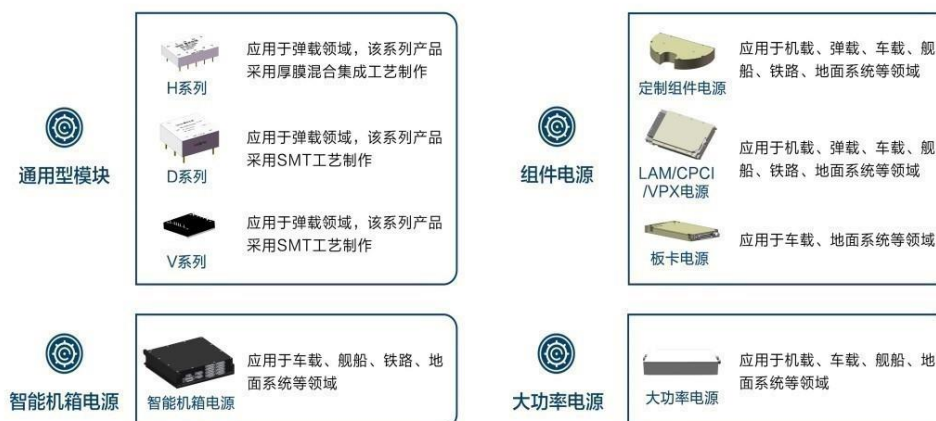
图 3 军工装备电源产品示意图

2021 年底，公司向特定对象发行股票募集资金 2.5 亿元，用于“基于电源模块国产化的多功能军工电源产业化项目”及“西安研发中心建设项目”建设。