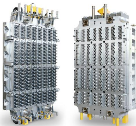
图-2 176 腔瓶坯模具