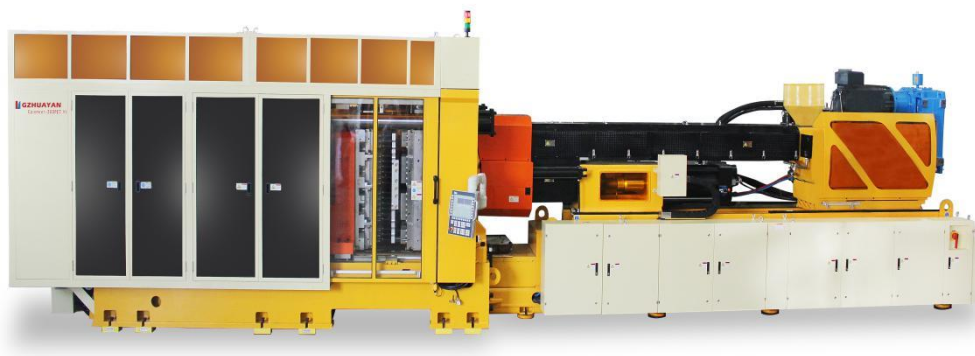
图-1 Epioneer-500 瓶坯智能成型系统

瓶坯智能成型系统由射台锁模机构、瓶坯模具、取件机器人、四套周边自动化单元以及控制系统等软硬件组成。整个瓶坯成型系统可通过单一操作界面对整个注塑成型过程的工艺参数进行实时数据交互和精准智能控制，常见参数如熔体压力及温度、各段机身温度、螺杆转速、喂料量以及电机的电流电压等，实现下游厂商在系统运行中在线检测、故障诊断、统计分析等功能。瓶坯智能成型系统主要有以下几个系列：高端 Epioneer 系列、中高端 EcoSys 系列、中端 HY-D 系列等。