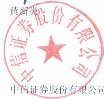
中信证券股份有限公司