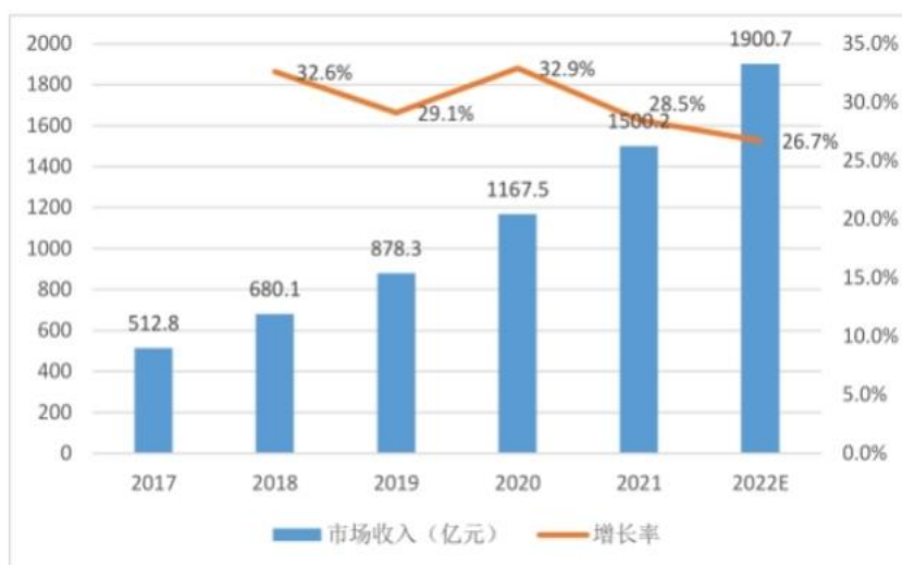
图 我国数据中心市场规模

心行业市场收入达到 1500 亿左右，近三年年均复合增长率达到 30.69%。随着我国各地区、和各行业数字化转型的深入推进，我国数据中心市场收入将保持持续增长态势。伴随海量数据所增长的储存和处理需求直接拉动国内 IDC 高速增长。以网络视频、电子商务、网络游戏为代表的互联网行业仍占据中国 IDC 业务市场主要市场份额，而随着信息化转型加快，以车联网、工业互联、物联网等为代表的新兴产业的市场份额将逐年扩大，催生大量数据处理需求，推动 IDC 需求规模增长。