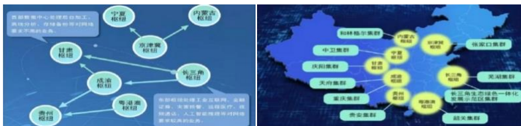
图 东数西算东西部行业迁徙分布