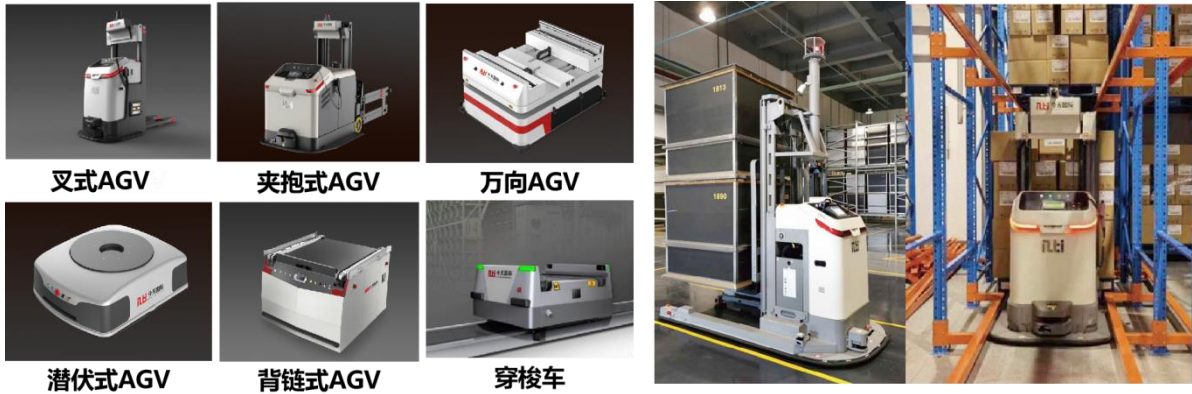
图 1：公司 AGV 系列产品

工业移动机器人是一种实现物料无人化搬运、堆码垛的智能物流设备。通过电磁导引或激光导引等方式，按设定的导引路线行进，能在生产车间、仓库和配送中心自动搬运输送，具有安全保护及各种移栽功能，无需人工驾驶，能为企业提高生产力，降低劳动成本。今天国际已有自主研发 AGV 产品近 30 种，如叉取型、定制属具型、潜伏顶升型等，所有产品都可以搭载 5G 通信方式进行信号传输。