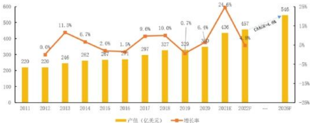
2011-2026 年中国 PCB 产值及增长率