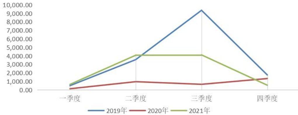
索道运输收入（万元）