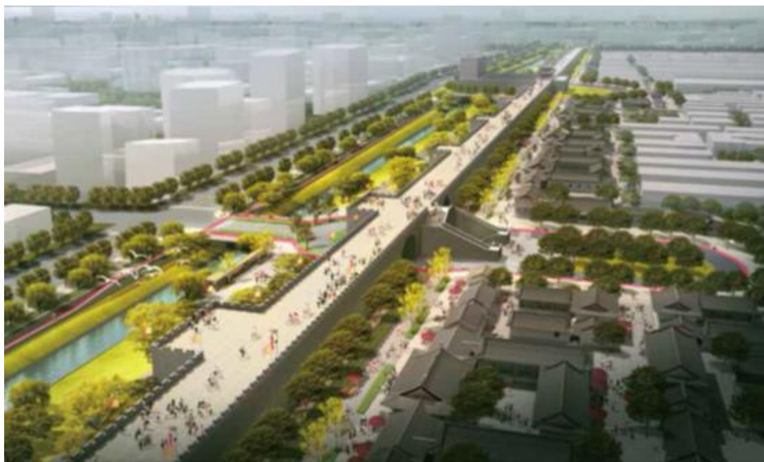
陕西西安 城墙、古都绿道修建性详细规划设计