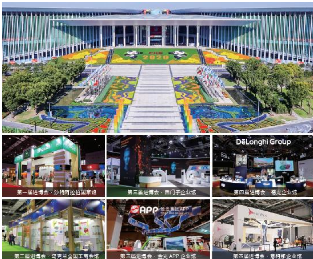
中国国际进口博览会指定服务商之一