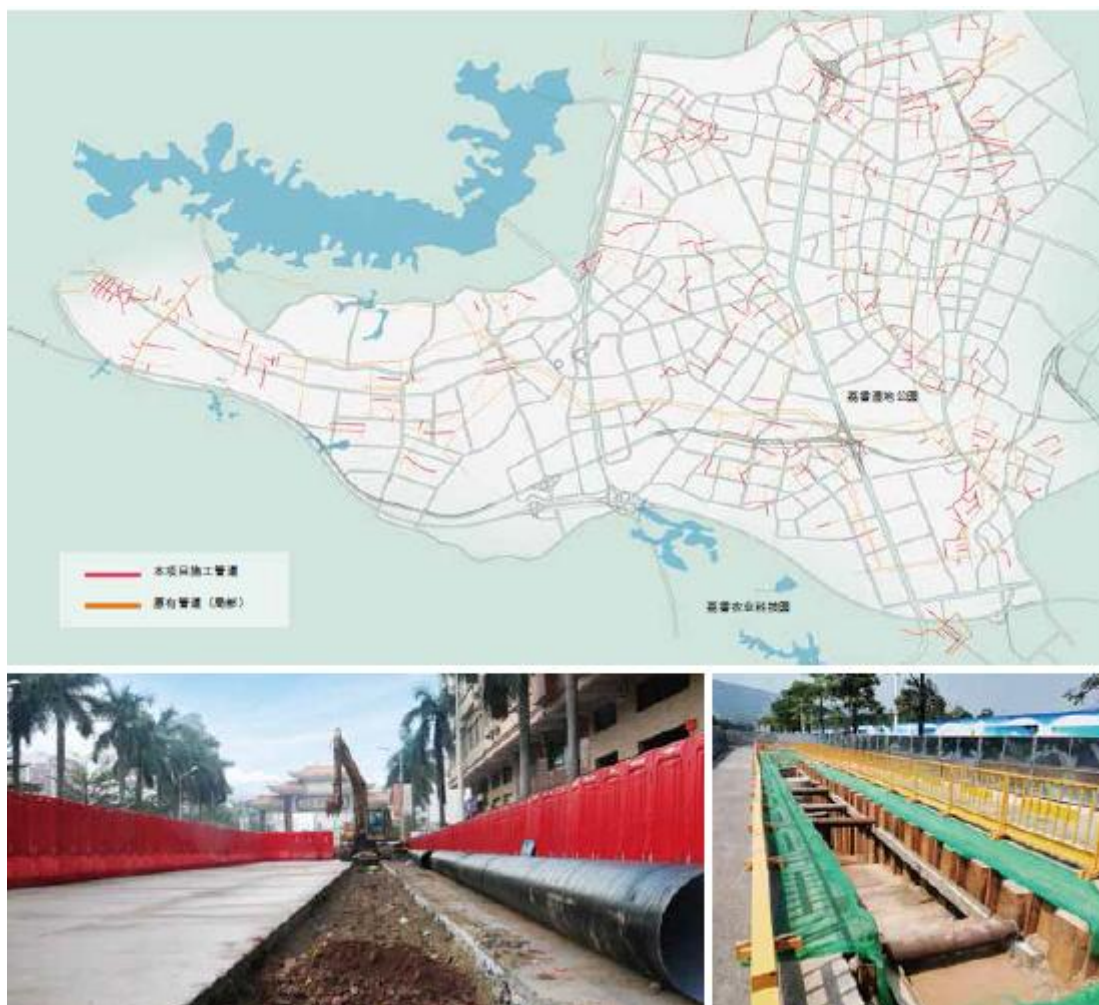
广东东莞 东引运河流域樟村断面综合治理（污水管网完善工程第四标段）

水务水环境治理业务： 公司业务聚焦于城乡水务、水利工程、水生态水环境三大领域，覆盖研发、策划、设计、投资、施工、运营全产业链。