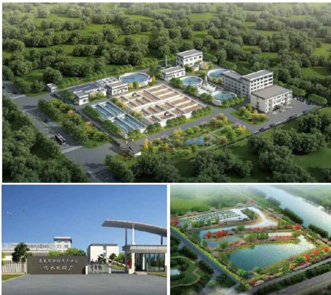
江苏兴化 戴南循环经济产业园区污水治理

文化旅游业务： 公司业务涵盖主题文化旅游的规划设计，主题文化景区（主题公园）的创意设计、旅游投资、景区建设、策划营销和运营，高科技文化创意产品，全球活动创意及展览展示，应急数字减灾等领域。