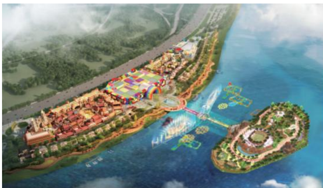
河北迁安 中唐天元谷文化旅游综合体魔方玩国乐园