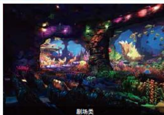
飞翔球幕影院、轨道骑乘等沉浸式体验主题产品