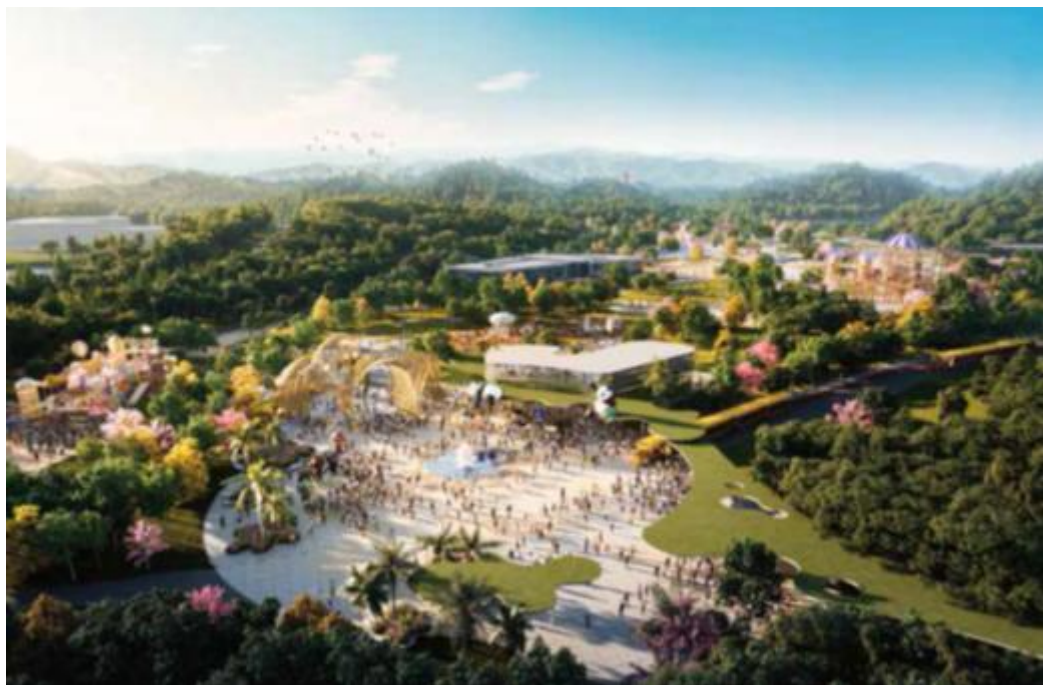
广东东莞·儿童公园规划设计