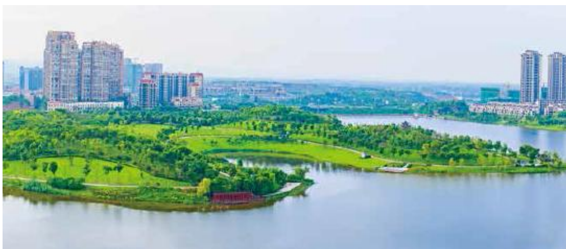
四川眉山 仁寿城市湿地公园景观工程