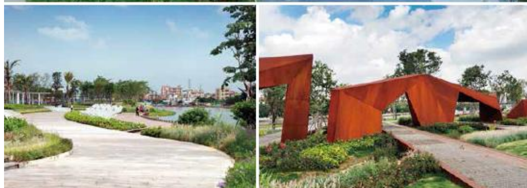
广东东莞 沙田镇西太隆河流域综合整治