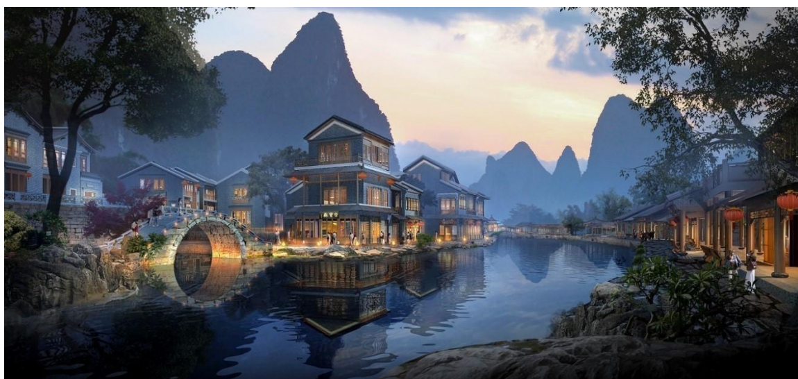
广西贺州黄姚古镇龙门街