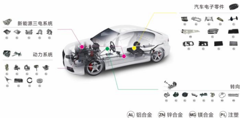
公司精密压铸产品在汽车的应用领域示意图

精密压铸业务主要从事铝合金、锌合金、镁合金精密压铸件、精密加工件的研发、生产、销售，并建立了模具加工及表面处理能力，打造一站式服务模式，提升产品配套及交付能力。目前拥有汽车关键零部件、精密3C电子部件及工业控制部件等产品线，公司专注“高精尖”领域，产品应用从动力系统、制动系统、转向系统等关键零部件延伸至新能源三电系统、热管理系统和汽车电子零部件（HUD、激光雷达、毫米波雷达）等，为客户提供有竞争力的、安心的产品与服务。