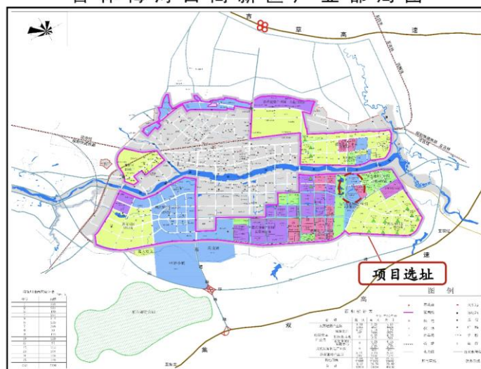
吉林梅河口高新区产业布局图

基于项目在东北的区位优势及辐射能力，并结合城市医药、食品加工及商贸物流产业特点，结合周边集聚生产制造企业及专业市场，该项目将采取“以仓储为主+精品干线分拨+物流配套”经营模式。物流项目整体占地面积为 456 亩。